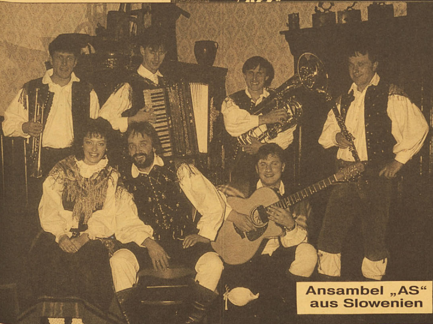
Ansambel „AS“ aus Slowenien