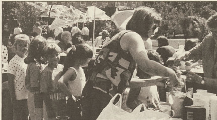
Prvič so na Letini pri Šmihelu praznovali vaščani. Uspeh je bil velik.