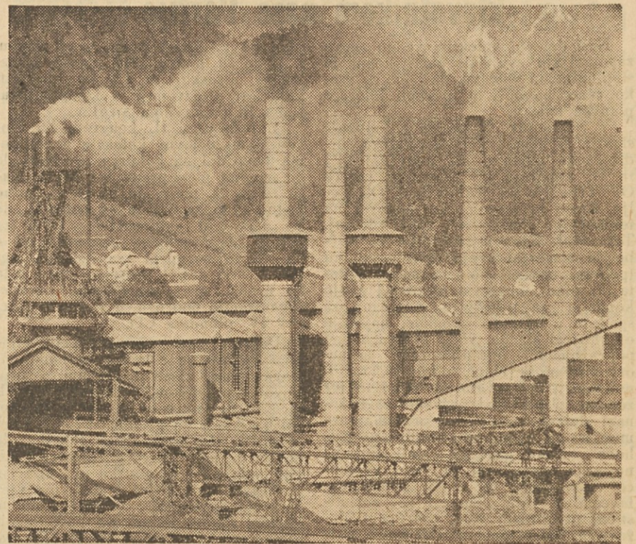
V tovarnah naše teže kovinske industrije gradijo naši kovinarji z zavestnim delom pod vodstvom ljubljene Partije s tovarišem Titom na čelu temelje boljšega življenja vsega delovnega ljudstva v socialistični Jugoslaviji

Z zgraditvijo navedenega ravnalnega stroja so naši delavci ponosno dokazali, da jih ni zmedlo ravnanje nekaterih demokracijskih držav, ki zaradi resolucije Informbiroja nočejo izpolnjevati svojih obveznosti napram naši državi. S ponosom odgovarjajo naši delovne ljudje klevetnikom z delom, s prezirom in studom zavračajo obrekovanja budimpeštanske radijske postaje in vseh drugih klevetnikov na ta način, da tekmovanja še bolj stopnjujejo, da še več naredo, boljše in hitreje, ker brezmejno zaupajo svoji Partiji.