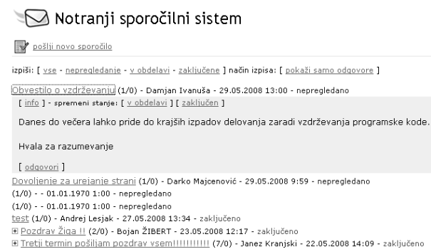
Slika 4 Vmesnik za komuniciranje med uporabniki SUV.

Modul NSS (Slika 4) je namenjen komunikaciji med uredniki. V pogovoru lahko sodeluje več urednikov, ki jih izbere avtor začetnega sporočila. Sporočila so lahko vezana na določeno objavo ali vsebino in so prikazana v večnivojski drevesni strukturi.