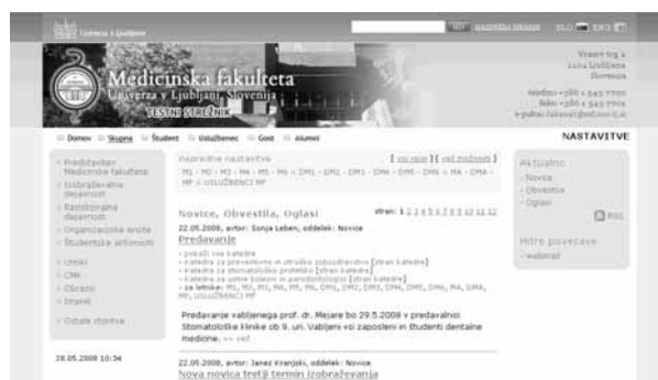
Slika 1 Začetna stran novega spletišča MF Ljubljana.

Zaradi drugačne vizualne podobe (Slika 1) in organizacije ponuja prenovljeno spletišče MF obiskovalcem čisto novo uporabniško izkušnjo. Poleg moderne in privlačne podobe je z uporabo bližnjic in naprednih možnosti omogočeno lažje in hitrejše iskanje zelenih informacij (npr. študenti samo spremembe predavanj, informacije o študiju, gradivo za študij, učitelji in zaposleni gradiva delovnih teles MF, naključni obiskovalci pa informacije o MF). Vsaka OE ima poenoteno obliko lastne (vstopne) spletne strani.