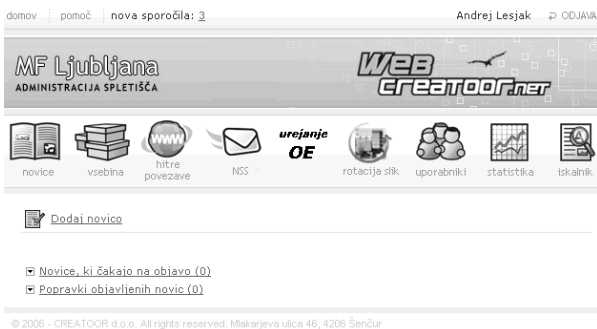
Slika 2 Uporabniški vmesnik SUV.

SUV omogoča ločevanje podatkov, programske kode in oblikovnih predlog. Prednost ločevanja podatkov je v tem, da je posamezen podatek shranjen le enkrat, vendar je lahko uporabljen večkrat (npr. novica namenjena določeni OE se lahko prikazuje skupaj z vsemi novicami ali pa le pri novicah "matične" OE). Za SUV so uporabljene preizkušene, napredne in odprtokodne tehnologije (npr. AJAX 4 ). Sistem deluje na odprtokodnem operacijskem sistemu Linux (CentOS).