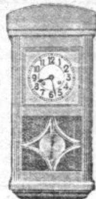
Stenske ure, ki gredo 14 dni in bijejo, od Din 380 navzgor

Zahtevajte cenik zastoj in poštine prosto