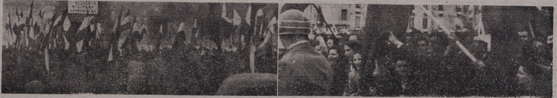
Briško, in vse primorsko ljudstvo odločno protestira proti francoski črti, na osnovi katere bi bilo prepuščeno imperialistom na desettisoče Slovencev