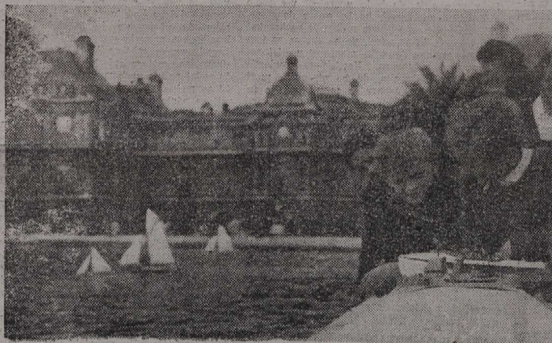
V LUKSEMBURŠKI PALAČI SO SE ZBRALI PREDSTAVNIKI 21 NARODOV, DA BI PREPREČILI STRAHOTE NOVH POKOLJEV, TODA... TI SE SE VEDNO IGRAJO VOJNO