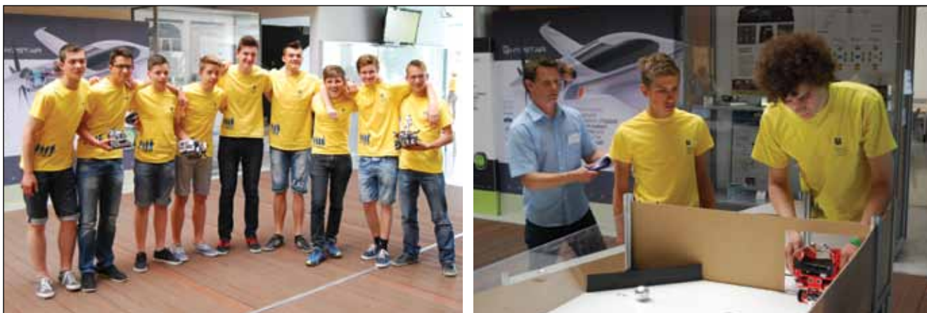
Slika 5. Ekipe ŠC Celje, Gimnazija Lava (levo), ki se vsakič prizadevno pripravljajo za sodelovanje na državnem tekmovanju RoboCupJunior, in ekipa MindGears s svojim samogradnim robotom (desno)

na odprtem državnem tekmovanju RoboCupJunior Slovenija 2015 polovica sodelujočih ekip gimnazijskih, druga polovica ekip pa je prihajala s strokovnih tehniških šol.