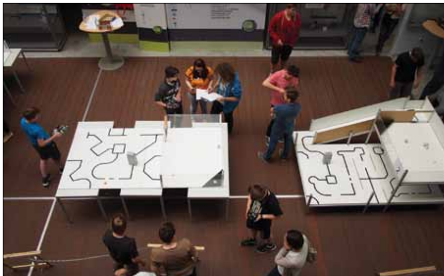
Slika 3. Tekmovalni areni za tekmovanje Reševanje črta (levo arena za OŠ, desno arena za SŠ)

robotskega tekmovanja za osnovnošolce in srednješolce. Tekmovanje RoboCupJunior ima zelo raznolike razrede tekmovanja: reševanje, ples in nogomet .