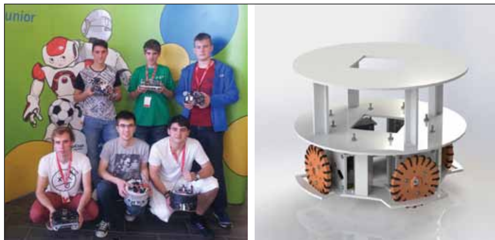
Slika 6. Ekipo ŠC Ptuj, Elektro in računalniška šola, in ogrodje robota za igranje robotskega nogometa