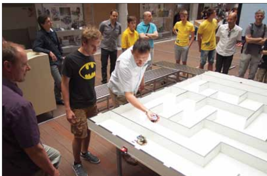
Slika 1. Dijak tekmovalca in navijača ob labirintu

To je tudi najstarejše slovensko robotsko tekmovanje, ki se ga je v petnajstih letih udeležilo že okrog 100 študentov ter nad 400 dijakov