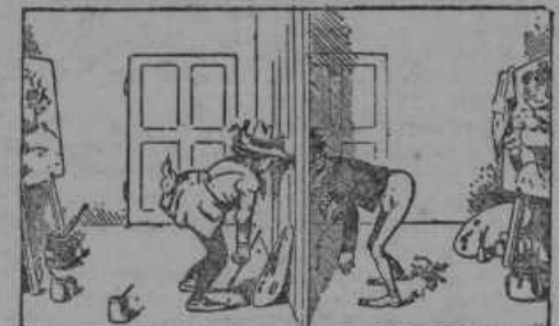
Drug drugega opazujeta.