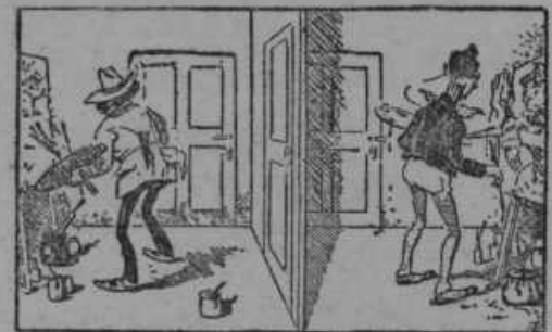
Dva slikarja dobita naročilo za isto sliko.