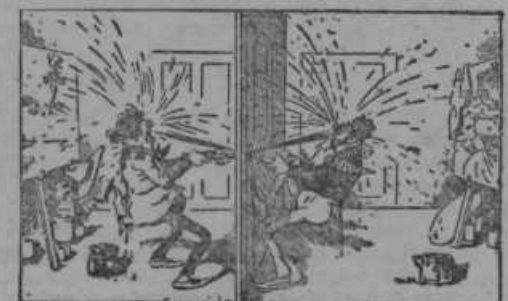
Skoz ključavnico brizgata...