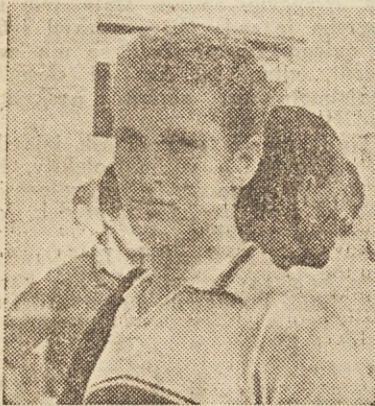
Bergant je danes zmagal

Turisti — člani (45 km): 1. Dimnik (Rog) 1:09.00, 2. Zupet, (Rog) 1:09.00, 3. Dobaj (Branik) 1:09.00, 4. Smrekar (Rog) 1:09.50. Turisti — mladinci (20 km): 1. Mrzlikar