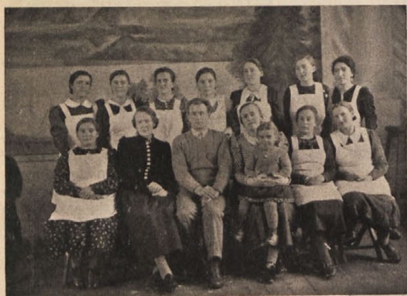
Slovenski kmetijsko-gospodinski tečaj v Ločah nad Baškim jezerom