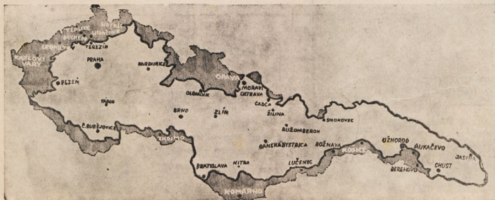
Tretjino svojega ozem- lja in prebivalstva je izgubila Čehoslovaš- ka po sklepih v Mün- chenu in Dunaju, da je Evropi ohranjen mir