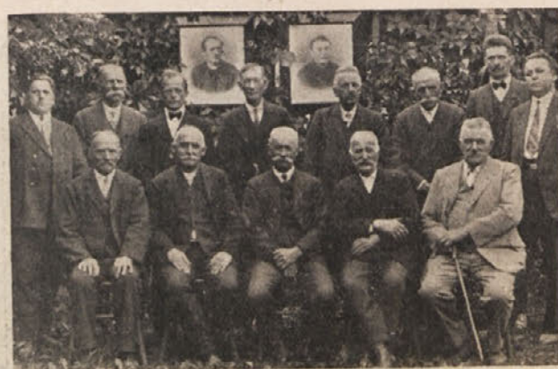
Slovenski posojilničarji v Št. Janžu v Rožu. Začetkom tekočega desetletja je praznovala šentjanška hranilnica in posojilnica svojo štiridesetletnico. Pet korenin je za tem pobrala bela žena iz vrst njenih odbornikov