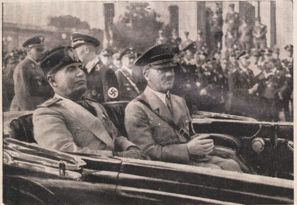
Adolf Hitler in Mussolini pred vele- političnim sestankom v Münchenu