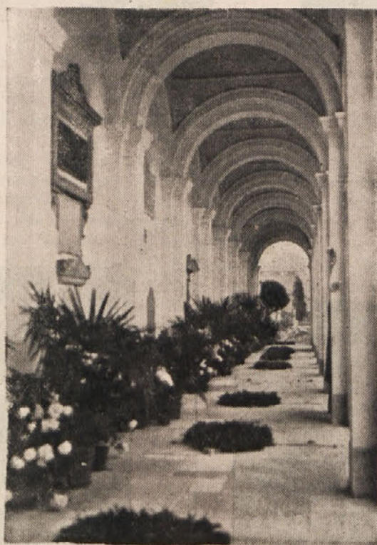
Navje, gaj zaslužnih Slovencev, ki bo še poznim rodovom govoril o zaslugah tvorcev in nositeljev slovenskega narodnega življenja