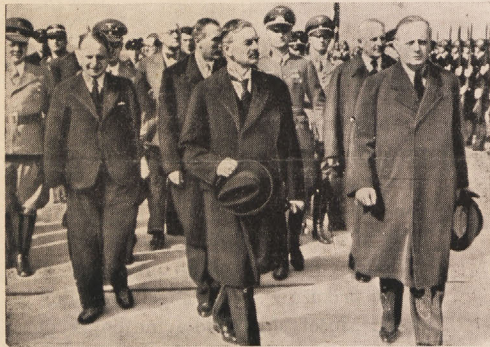
Angleški ministrski predsednik Chamberlain v spremstvu nemškega zunanjega ministra Ribbentrop-a po prihodu na letališče v Münchenu