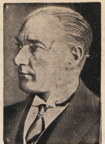
† Kemal Atatürk, pre- roditelj nove Turčije