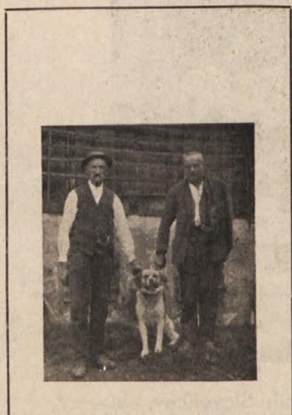
Kremenita rožanska tipa iz Št. Jakoba