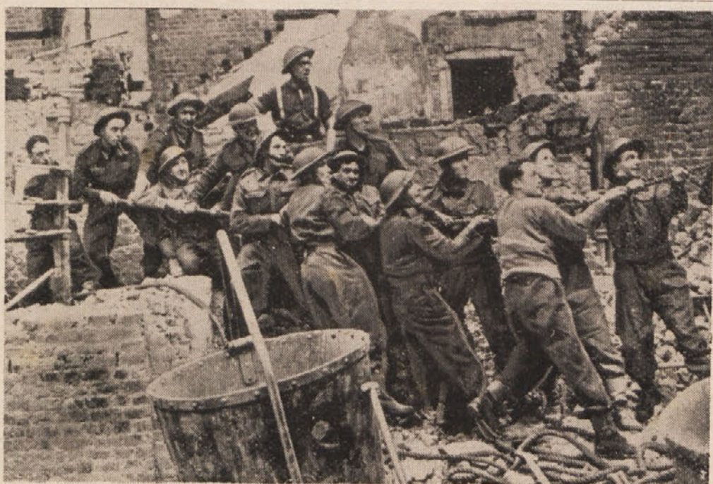
Londonski delavci spravljajo razvaline, ki se v mestu kopicijo z vsakim dnem. Tisoči pionirji so neprestano na delu in še ne zmorejo ruševinskih kupov.

2. decembra: Na grški fronti so bili ostri nasprotnikovi napadi zavrnjeni.