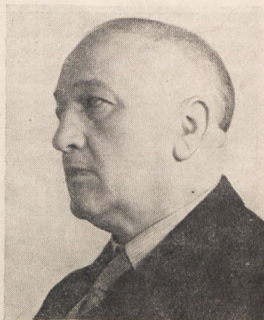
Notranji minister dr. Anton Korošec