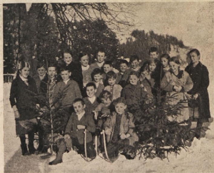
Nadebudna slovenska mladina iz Loč nad Baškim jezerom na izletu v zimsko naravo