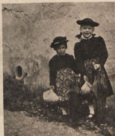
Rožankici iz Kaple ob Dravi