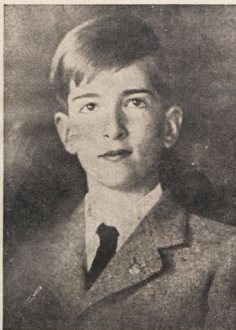
Mladi jugoslovanski kralj Peter II.