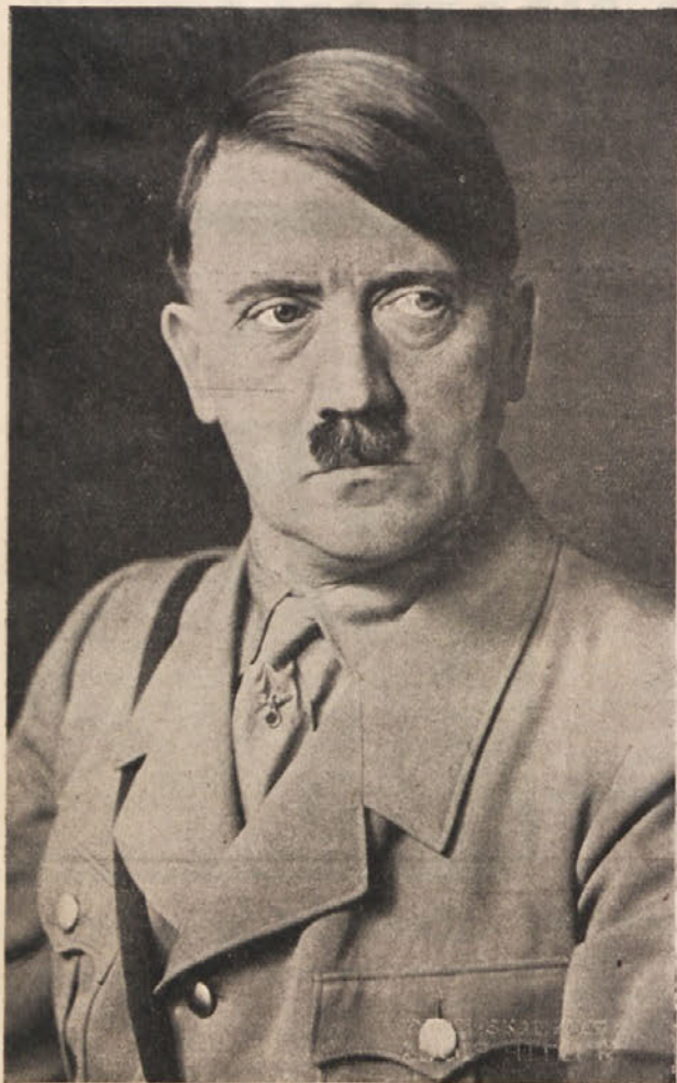
Führer in kancler Adolf Hitler