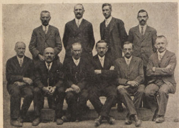
Slovenski posojilničarji v Dobrli vesi. Dobrlaveška posojilnica in hranilnica praznuje v novem letu svojo petdesetletnico