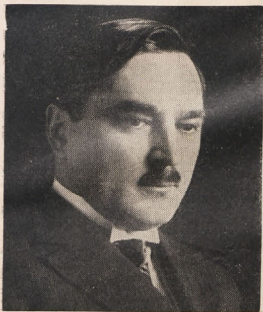
Ministrski predsednik dr. Milan Stojadinović