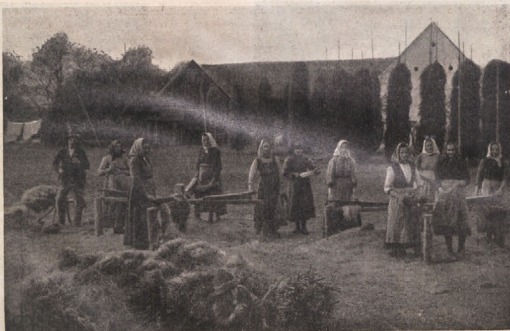
Terice v osrčju naše Podjune. Kako pravi pesem: Le tisto dekle kajžvelja, ki obleko vso domačo ima!