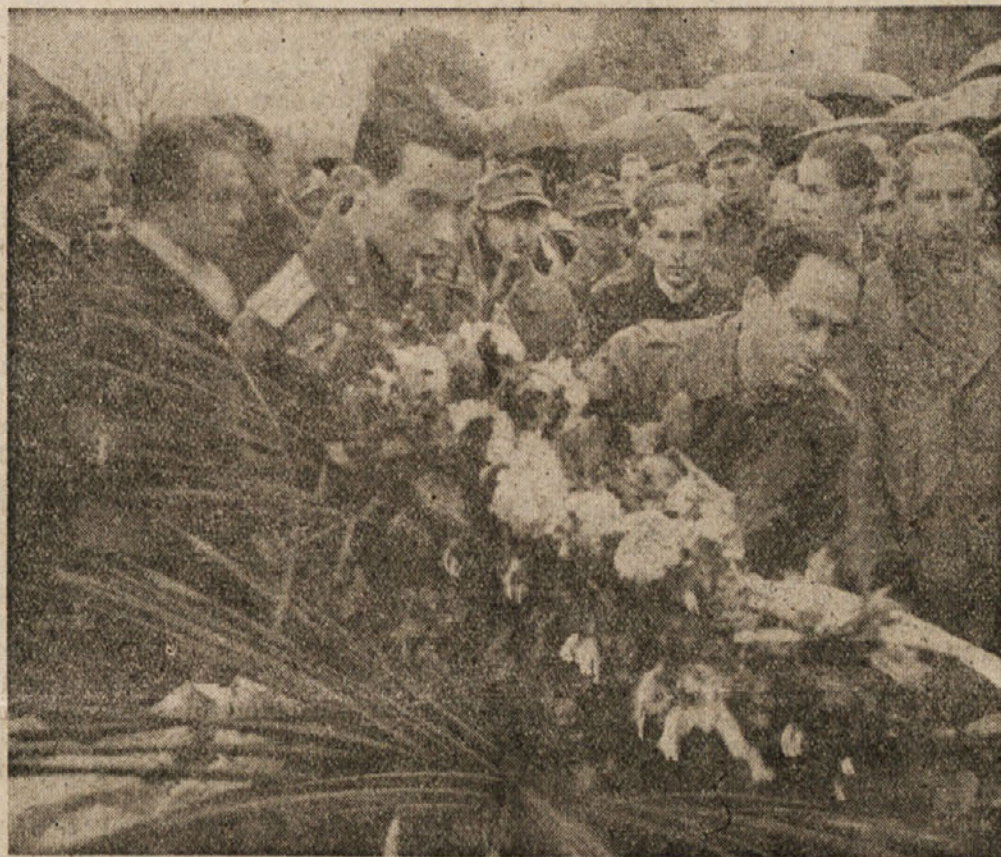
Zastopnik JA polaga venec na grob slovenskih partizanov v Št. Rupertu

sti ter delo vlade strogo po smernicah OF. Zelo vzpodbudno je dejstvo, da predstavlja izvoljena Ustavodajna skupščina enoten političen blok edinstvene težnje našega ljudstva, ki je ne bodo razdejale strankarske strasti in katere dela ne bodo motili notranji spori nasprotujočih si poedincev ali skupin, izvirajoči iz prestižnih političnih motivov. Politični in socialni sestav skupščine je tak, da ima vse pogoje za svojo visoko delovno sposobnost in da bo obravnavala, ocenjevala ter kritizirala delo njej podrejenih najvišjih izvršnih organov z enim samim edinstvenim osnovnim pogledom naprej ter z eno samo osnovno edinstveno težnjo, da čim hitreje prebojimo vse težave in si čim hitreje utremo pot k napredku, tistemu napredku, ki ustrezata bistvenim interesom našega delovnega ljudstva.