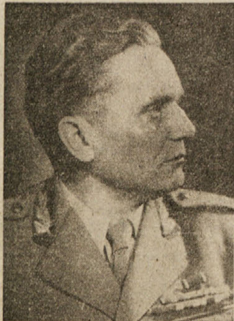
Josip Broz — Tito

Program Fronte pomeni najtočnejše izvajanje socialnih ukrepov za ublažitev bede med najbolj siromašnimi slo-