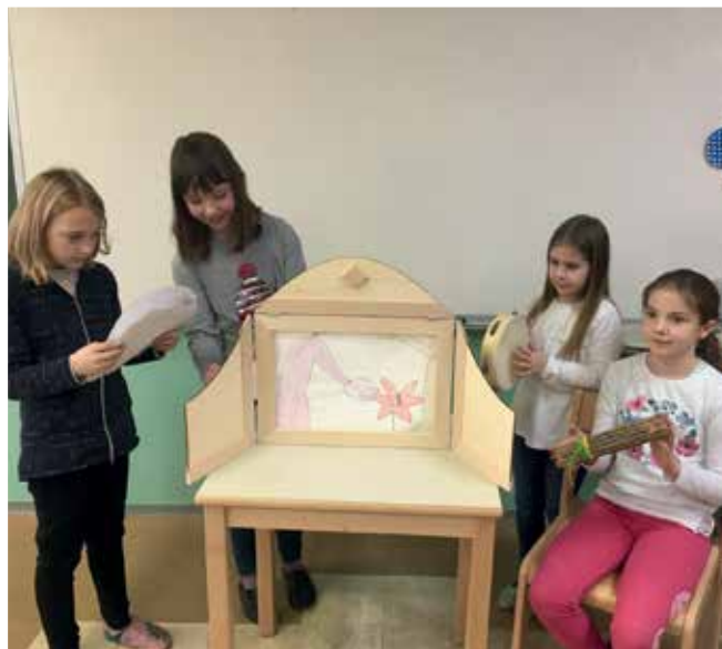
► SLIKA 3: Izziv meseca

Kurikularne povezave praviloma načrtujemo zaradi njihove dodane vrednosti, avtentičnih dosežkov oziroma rezultatov, ki jih brez njih ne bi mogli doseči. Tovrstni dosežki pogosto spominjajo na realne življenjske problemske situacije in vključujejo vrsto različnih miselnih procesov oz. načinov procesiranja obravnavanih vsebin (Rutar Ilc, 2010: 115). Izziv meseca je zajemal prav vse to. Končni rezultat medpredmetnega projektnega dela je bil namreč napovednik za filmsko, baletno ali operno predstavo izbrane Andersenove pravljice v gledališču kamišibaj.