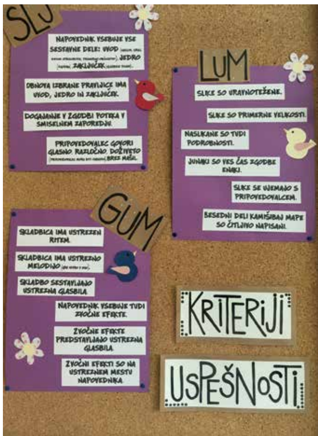
► SLIKA 5: Kriteriji uspešnosti med učnim procesom projektne dela, ki se nanašajo na cilje in namene učenja v projektne delu.