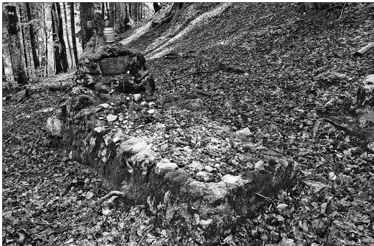
Slika 5: Grob Petra Polovčeva – »neznanega ruskega ujetnika« v bližini kapelice.