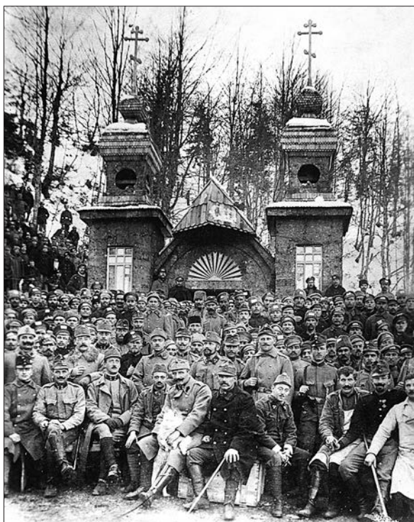
Slika 1: Ruski vojni ujetniki in avstro-ogrski vojaki pred Rusko kapelico. Fotografija je bila verjetno posneta konec leta 1915, kapelica pa še ni bila popolnoma dograjena (inv. št. R 119).

Med manj pomembne napačne interpretacije dediščine sodi ljudsko poimenovanje odseka ceste, ki vodi od današnje Tonkine koč mimo Poštarskega doma na trentarsko stran. Odsek, ki je danes namenjen le pohodnikom in kolesarjem, je poznan kot »ta stara cesta«. Poimenovanje je razširjeno predvsem med kranjskogorskimi domačini, razlog za poimenovanje ceste kot take pa je preprost. Po končani prvi svetovni vojni je bila cesta preko Vršiča v vedno slabšem stanju, na kar so opozarjali tudi številni tedanji časopisi. 4