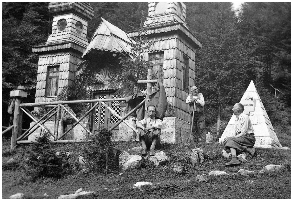
Slika 4: Kapelica po letu 1937, ko je bila ob njej zgrajena grobnica. Prvotna obloga iz lubja je bila zamenjana s skodlami (brani Brane Horvat).

čevskim plazom, 34 kar dokazuje zgodnejši obstoj kapelice. O dilemi o času gradnje kapelice je leta 2018 pisal že Janko Boštjančič, 35 omenjena razglednica (fotografija) pa je bila predstavljena tudi na razstavi Življenje za cesarja v Parku vojaške zgodovine v Pivki. 36 Dodaten dokaz o njeni zgodnejši izgradnji se je pojavil leta 2019, ko se je na spletu prodajal album fotografij, med katerimi so bile tudi fotografije prestolonaslednika Karla ob obisku Kranjske Gore, Vršiča in Trente 11. januarja 1916. Med fotografijami je bila tudi do tedaj neznana fotografija Ruske kapelice. Glede na stopnjo dograjenosti objekta je razvidno, da je fotografija, posneta 11. januarja 1916, sicer kasnejšega nastanka kot do sedaj vsem znana fotografija z vojnimi ujetniki in stražarji. 37