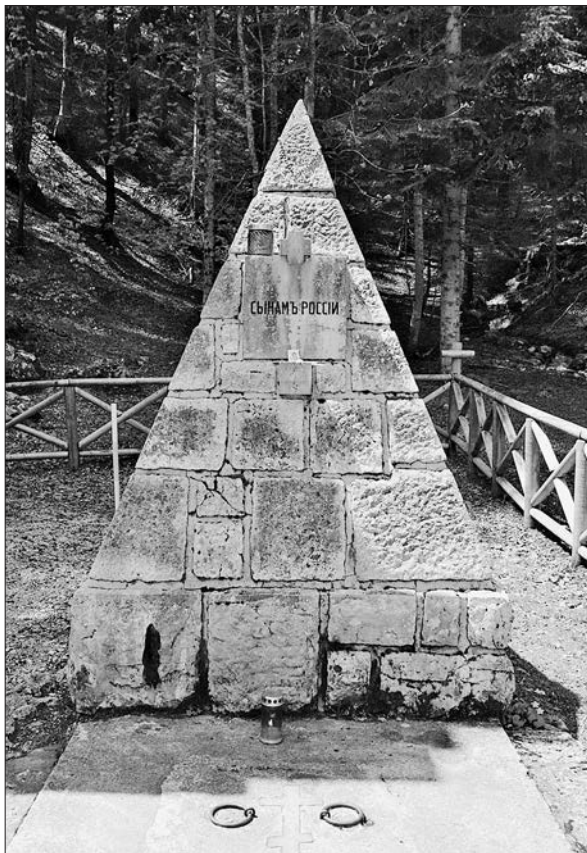
Slika 7: Grobnica ruskih vojnih ujetnikov, za katere zaenkrat ni znano, od kod so bili prineseni.

Med domačini iz Kranjske Gore in v objavah lahko zasledimo, da so v grobnico prenesli tudi posmrtno ostanke z vojaškega pokopališča v Kranjski Gori. 65 Resnica je nekoliko drugačna, saj vsi arhivski dokumenti govorijo o tem, da so posmrtno ostanke večine ruskih vojnih ujetnikov s kranjskogorskega vojaškega pokopališča prenesli v beograjsko grobnico. 66 Na tem mestu je treba omeniti, da je bilo na civilnem kranjskogorskem pokopališču pokopanih tudi 24 ruskih ujetnikov in 12 avstro-ogrskih vojakov, 67 o njihovih prekopih pa za zdaj ni znanih nobenih podatkov. Morda so bili prekopani h kapelici, a za potrditev bo treba najti ustrezno arhivsko gradivo.