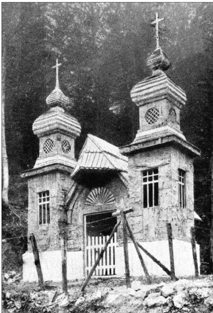
Slika 3: Podoba kapelice v zgodnjih povojnih letih. Fotografija je verjetno nastala po prvi obnovi, saj sta bila prvotna pravoslavna križa na strehi (glej sliko 1) zamenjana s katoliškima.

je razvidno, da se je kapelice prijel spominski vidik zaradi vsakoletnih proslav, ki so potekale ob njej. V časopisu Slovenec tako v daljšem opisu proslave in počastitve umrlih ruskih vojnih ujetnikov leta 1929 zasledimo, da bo »kapelica /.../ vedno ostala spomin na njih težko usodo ter neomajno versko prepričanje«. 30 Do očitnejše povezave kapelice in žrtev plazov je moralo priti kasneje, saj prvo neposredno omembo takšnega vzroka postavitve zasledimo leta 1939: »Vsi ti vojaki so umrli pod plazovi in vsi so kar tam pokopani. Mene je kar groza obšla, ko sem hodila med tistimi grobovi. V spomin so jim postavili kapelico in ji dali ime Ruska kapela.« 31 Takšna povezava je sicer posredno nakazana že leta 1928, ko se omenja pokop »več sto« žrtev plazov, nad grobovi pa naj bi postavili »pravoslavni božji hram v pristnem ruskem slogu«. 32 Tudi v času