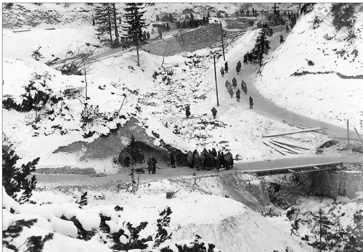
Slika 8: Vojni ujetniki na cesti pod tedanjo Rimlovo kočo.