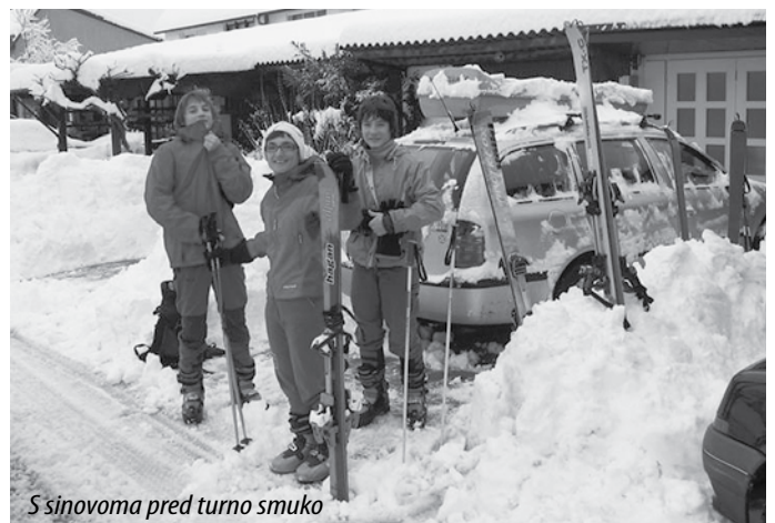
S sinovoma pred turno smuko

Zagotovo je glavni razlog nezadovoljstvo ljudi s sodnim sistemom; podobno kot pri zdravnikih. Sodniki ne moremo uživati ugleda, če mora stranka več let čakati na odločitev, zlasti še, če je odločitev na koncu formalistična in neživljenjska. Nekateri menijo, da k slabemu ugledu pripomore tudi negativen odnos politike do sodstva. Nedvomno, vendar če bi sodni sistem deloval dobro, nam tudi podcenjujoč odnos politike ne bi mogel do živenga. Mislím, da je zelo pomembno, da so sodniki kvalitetni. Da bi rešili sodne zaostanke, smo v preteklosti zelo povečali število sodnikov. V tako majhni državi, kot je Slovenija, preprosto ne moreš dobiti tisoč res kvalitetnih pravnikov. Tako veliko povečanje števila se nujno odrazi na kvaliteto. Zato je zmanjševanje števila sodnikov in nadomeščanje sodnikov s sodnim osebjem zagotovo prava pot. Sodnik mora biti zato, da odloča neodvisno, zaščiten pred vplivom in nadzorom politike. Vendar je zato toliko bolj pomembno, da sodniki sami znotraj svojih vrst poskrbimo za odgovorno delo. Tu smo v zadnjih letih naredili korak naprej, bo pa to ena pomembnejših nalog tudi v naslednjih nekaj letih.