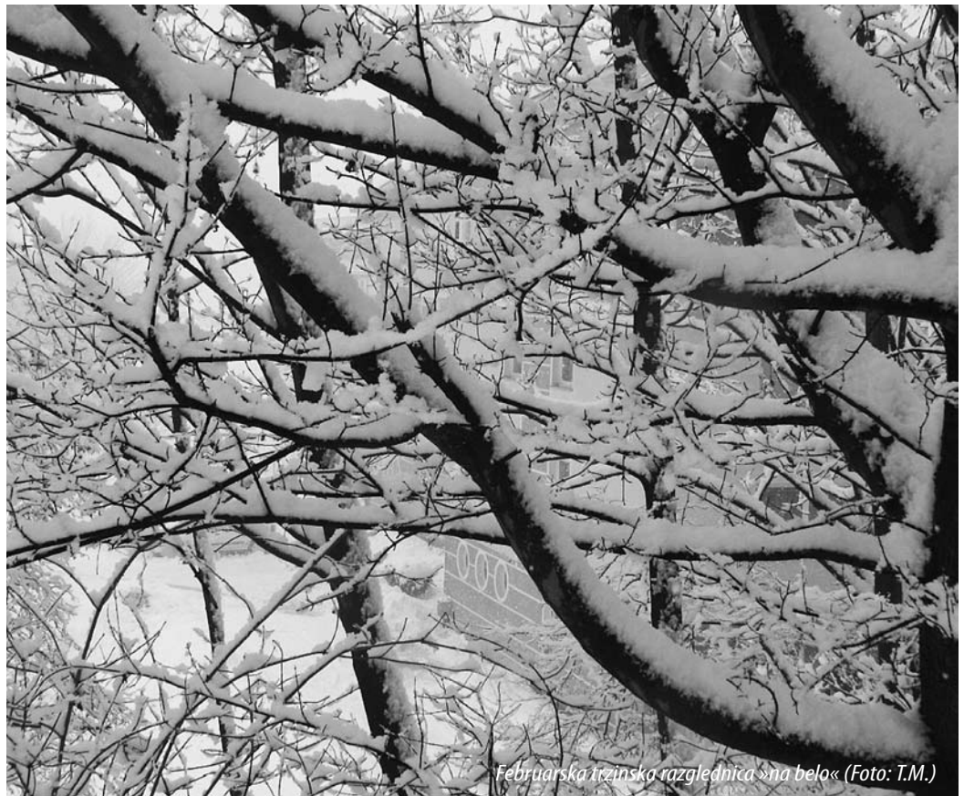
Februarska trzinska razglednica »na belo«

opravka s snegom v glavnem med novembrom in marcem, pada lahko tudi druge mesece, a ga hitro pobere. V snežni sezoni 1995/96 smo imeli na tleh sneg več kot 100 dni. V alpskih dolinah in višje je bilo letošnje zimsko trimesečje tako po višini snežne odeje kot tudi trajanju sončnega obsevanja slabše od lanskega. Se je pa po trajanju snežne odeje meteorološka zima izkazala predvsem v Ljubljanski in Celjski kotlini