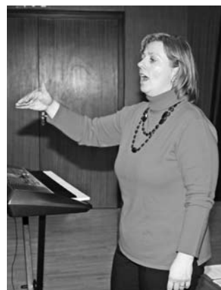
Ksenija v elementu