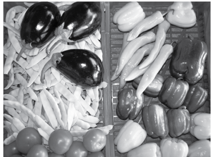
Odlični domači pridelki iz lokalne kmetije

lokalnem trgu in z njo skrajševanje tržnih poti ”iz njive na mizo” . Na ta način želimo povečati lokalno samooskrbo s pristopom »iz regije za regijo« , saj ima ta številne pozitivne učinke: zagotavlja prihodek lokalnim proizvajalcem, potrošniki uživajo bolj sveže in