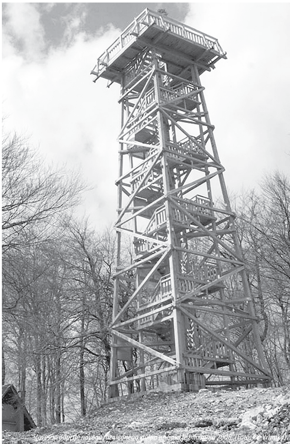
Stolp, ki je bil pred letom 2008.