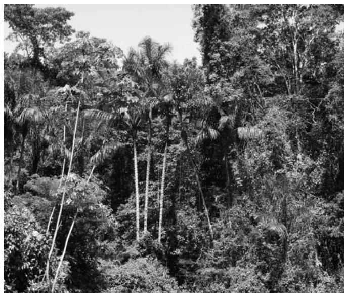
Tropski deževni gozd. Vsak dan človek poseka 25 tisoč hektarov tega gozda. Zato vsak dan izumre 50 vrst organizmov, ki so s tem za vedno izgubljeni. Nato na poseki posadimo palme in posejemo sojo za ekološko biogorivo in biohrano.

Pridružite se nam – ali pa kateri drugi skupini, ki bo 'pospravljala Trzin'. Naj bo po tej soboti pogled na naš kraj spet lepši!