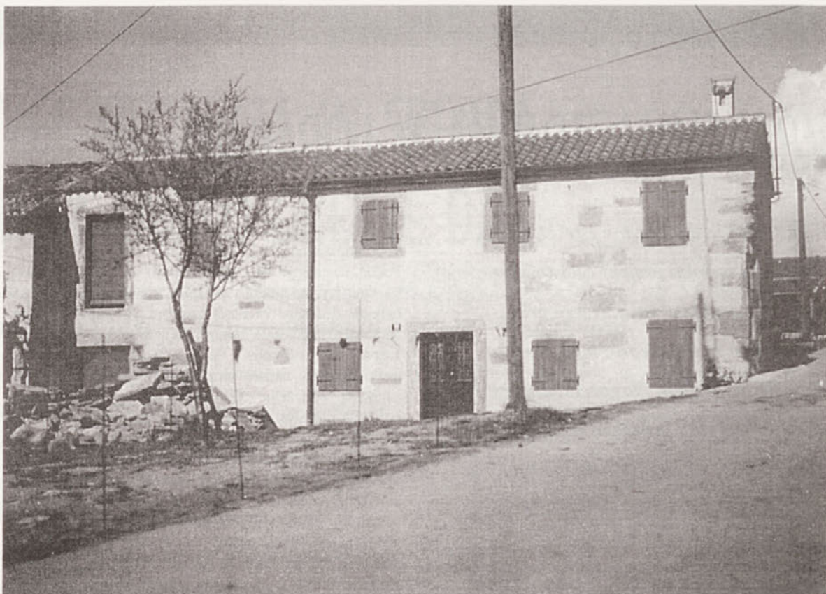
Obnovljena Bardinčeva hiša v Loparju, kjer bo postavljena krajevna zbirka.

osveščanja o lastni kulturi biti ter v funkciji oblikovanja kulturne turistične ponudbe. Zato je hkrati kulturno-raziskovalne, razvojne in socialne narave. Predstavlja vezni faktor ter vzpostavlja komunikacijo v kraju in širšem okolju. Muzejska zbirka bo odigrala svojo razvojno vlogo v turistične namene. Namenjena je domačinom, šolam, raziskovalnim in ljubiteljskim skupinam ter posameznikom, ki želijo spoznati Istro. Ne glede na fizično velikost je kot muzejska predstavitev slovenske Istre, ki leži na robu slovenskega etničnega in državnega območja, tudi nacionalnega pomena.