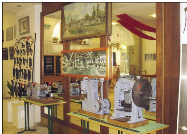
Na razstavi so bili dokumenti, keipi pa maketi tō

Za tau, ka se naredi edna navadna kosa, je trbōlo napraviti 42 fēle del. V koso so nutvrežali simbol delavnice, ka aj bi kŭpci znali, gde so go naredili. Med lejtami 1902-2001 so v Monoštri redili 190 fēle kos, zvekšoga na mašinaj, šteri so bili tam že od začetkov pa so gnes muzealna vrejdnost. Zvŭn kos so eške redili kosice