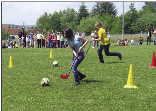
Vsefelé športne špile so čakale mlajše

zdravo vse navzauče. Najoprvin se je zavalo županji Sakalauvec, ka je dala mesto za piknik, te pa je želo mlajšam lejpe poletne počitnice pa proso, ka aj se dale flajšno včijo slovenski materni