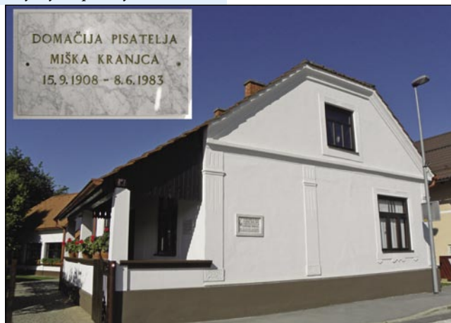
Domačija Miška Kranjca, za katero vzorno skrbi občina Velika Polana, in kjer se začneja Slovenska pisateljska pot, opisana v obsežni publikaciji na 350 straneh

na Gornjem Seniku od 8.30-9.30 ure, na Dolnjem Seniku od 9.40-10.10 ure, v Sakalovcih od 10.20-10.40 ure, v Števanovcih od 11.00-11.45 ure in v Monoštru pri hotelu Lipa od 12.15-13.00 ure.