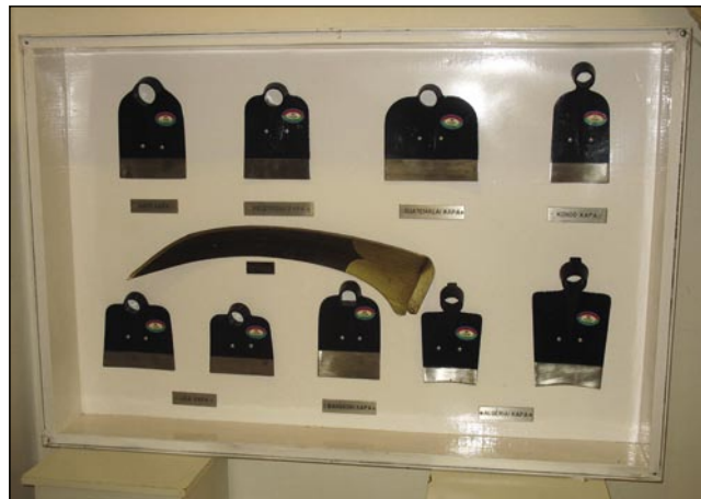
V varaškoj fabriki so redili motke za cejli svejt

ci, potom toga pa so začnili nutvčiti domanje delavce iz Varaša pa krajine kauli njega. Dosta Slovincov je delalo v tom cajti v monoštrskoj kosinoj fabriki, eške gnes živejo takši nekdešnji delavci.