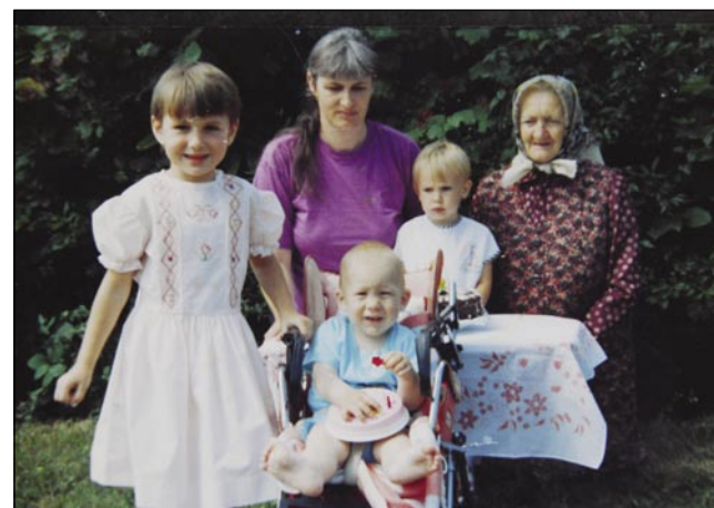
Stari kejp z mamov pa mlajši, steri so zdaj že velki pa se včijo na univerzi

Dejdek je fejest šparo, ešče te tü, gda sta z očov v gauštjo šla. Dostakrat sta se sfadila pa sta domau z gauštja prišla, zato ka dejdek nej püsto baur podrejt, zato, ka je lejpi ali zato, ka aj ešče raste, na slejdnje sta pa te tak domau prišla, ka enga sta nej podrla. Za volo tauga, ka smo srmacke bili, so nas fejest dola gledali. Ešče sledkar mi je