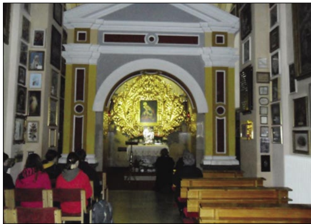
Pred milostno podobo Marije Pomagaj na Brezjah

Med občudovanjem večno lepih krajev po Sloveniji smo pravočasno prispeli na Brezje. Pred