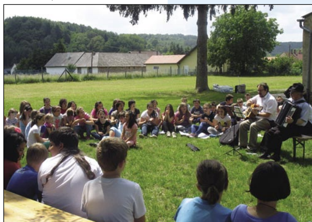
»Mejšani pevski zbor« s Sinika pa Števanovec