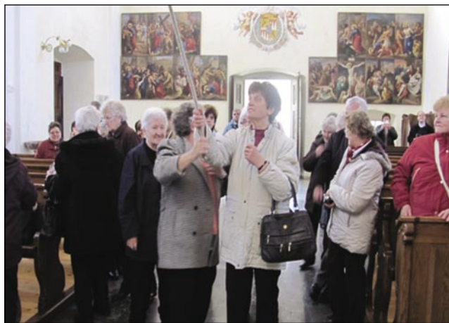
V cerkvi Marije Vnebovzete na blejskem otoku

Brezje je začelo obiskovati vse več romarjev v 19. stoletju, ko se je ob milostni podobi Marije Pomagaj zgodilo več uslišanj in dvoje čudežnih ozdravitev. Leta 1988 je cerkev Marije Pomagaj na Brezjah papež Janez Pavel II. razglasil