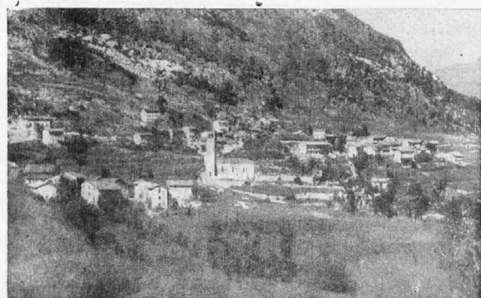
ČRNI VRH V BENEŠKI SLOVENIJI