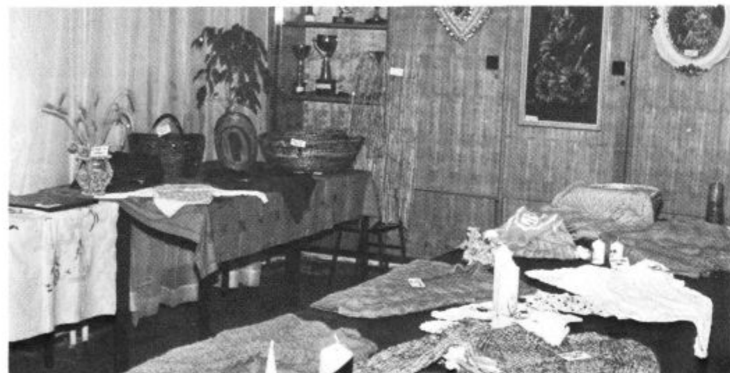
Razstavo ročnih izdelkov invalidov si je bilo vredno ogledati

nov, si ne bi mogli zamišljati v tej težki gospodarski situaciji, če ne bi imeli naših dobrotnikov, od katerih dobivamo finančna sredstva. Z veliko mero razumevanja nam jih odmerjajo in pošiljajo ter s tem močno krepijo in podpirajo našo dejavnost. To so: Zveza društev invalidov SR Slovenije v Ljubljani, Skupnost socialnega skrbstva občine Lenart, Skupnost pokojninskega in invalidskega zavarovanja, Občinska zdravstvena skupnost.