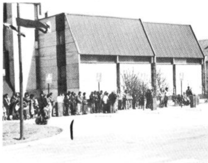
Nova avtobusna postaja — kdaj dalje v izgradnji objektov?

V mestnem naselju Lenarta ter za naselje Radehova je v izvajanju izkop jarkov, v katere polagajo primarne kable za telefon in satelitsko televizijo.