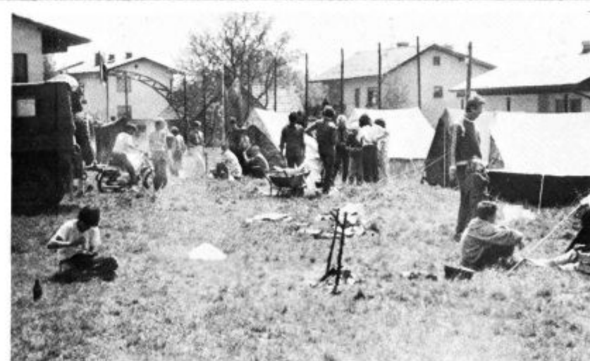
Taborniki si hitro uredijo bivalno okolje

Začeti je bilo težko. Sedaj nam je že veliko lažje. Veliko tabornikov je opravilo vodniški izpit. Med njimi je osem mladincev-srednješolcev. Ti se vsak teden dobivajo s svojimi taborniki. Veliko akcij je skupnih. Takrat je posebej veselo, zlasti če poleg vsega še zadiši iz kotličev, v katerih otroci sami kuhajo okusno kosilo. Tu so še izleti, pohodi, plesi, družabna srečanja, prireditve, očiščevalne akcije, tekmovanja in še marsikaj. Tudi učenje! Da nismo od muh, govori pokal, ki