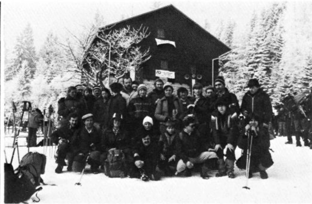
Pohod na Stol je vedno znova izziv za planince

Že od ustanovitve si društvo prizadeva in daje velik poudarek izobraževanju svojega članstva. Tako se je dosedaj izšolalo pri planinski zvezi Slovenije 18 mladinskih vodnikov in 5 mentorjev za delo z najmlajšimi člani. Kljub tej zavidljivi številki mladinskih planinskih vodnikov ugotavljamo, da le teh v zadnjem času primanjkuje, vzrok temu je odseljevanje, nadaljevanje študija in drugo. V bodoče bo potrebno poskrbeti za šolanje novih, saj na izletu nikoli ni zadosti stro-