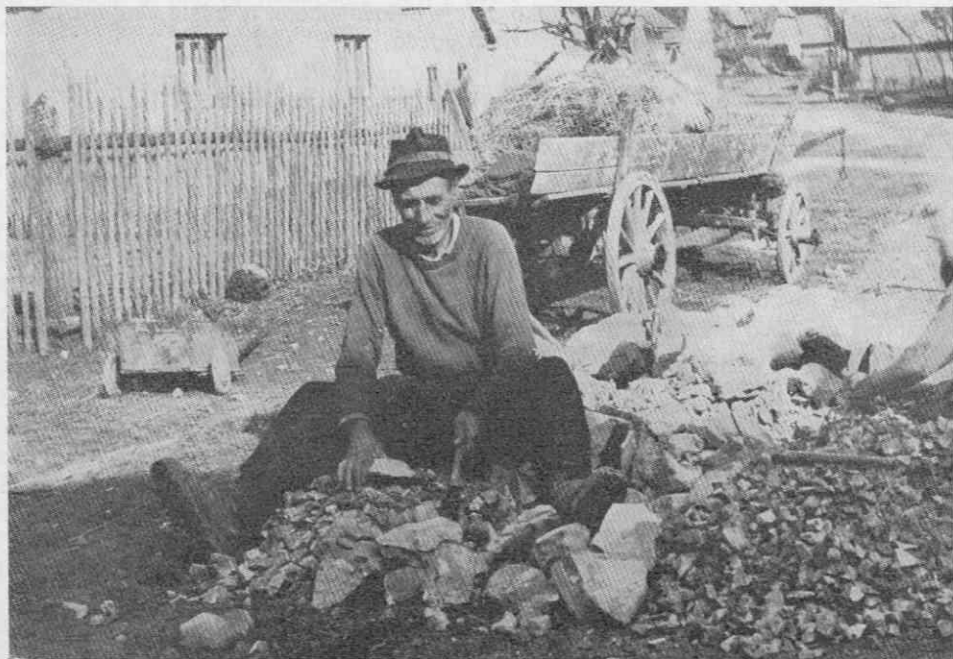
Slika 8. Cigan iz rodu Hudorovič v Kočevju drobi gramoz

V ciganski družini tolčejo kamen moški in ženske ter napol odrasli otroci. Ker so kamnolomi v raznih krajih, precej oddaljenih med seboj, je ciganska družina večkrat daleč od svojega bivališča. Zato se Cigan, ki prevzame tako delo, navadno s svojo družino začasno odseli; le najpotrebnejše imetje naloži na voz, vpreže konja in se odpelje na delo.