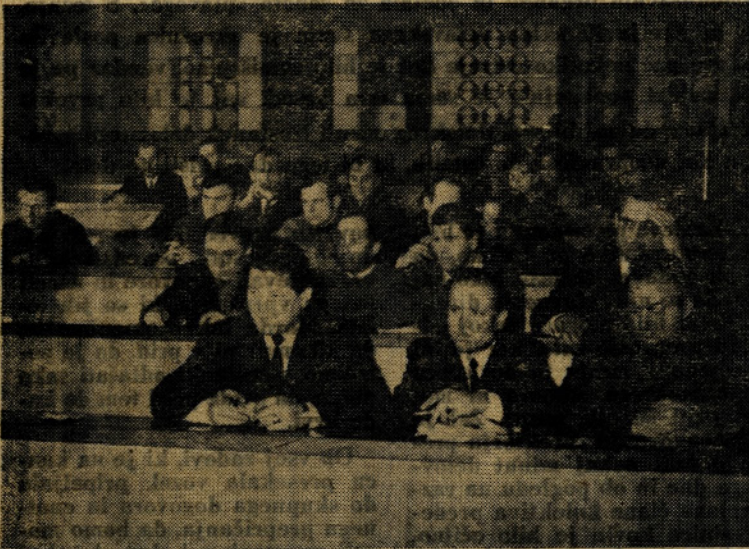
»Uslužbenci« so se »svojega« občnega zbora le slabo udeležili