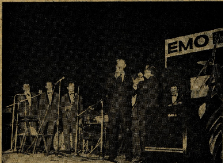
»Elegantno, moderno, otmeno...«

PRIČELO SE JE NOVO POSLOVNO LETO, NA PRAGU JE NOVA AKCIJA, ZATO DOBRODOŠLA V VSAKEM DOMU EMO — 8 IN EMO — 5 (IN NE POZABITE NA NAGRADE!)