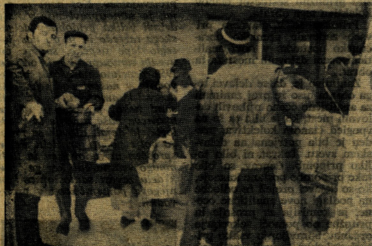
Kot na sejmu...

Tudi glede čistoče naših porcij za malico bi se dalo govoriti. Nismo vse krivi mi, če se obtolčejo, toda umazanija za robovi le ni naša, temveč malomarnosti samopostrežne restavracije. Dobro bi bilo, ko bi vsaj enkrat tedensko pregledali,