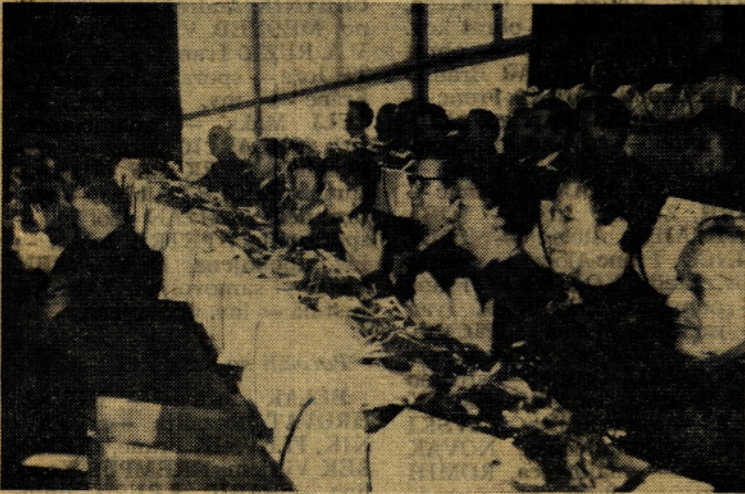
Besede Milana Zupaneke ob slovesu lanskih upokoencev