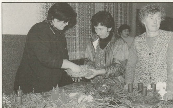
Podeželske žene pri izdelavi adventnih venčkov

Samo en korak je bilo potrebno narediti, da je prišlo do prvega skupnega srečanja žensk v novoustanovljeni KS Sela in potem tudi do ustanovitve Združenja podeželskih žensk Sela. Pomagalo jim je domače Kulturno društvo, v okviru katerega bodo delovale, prvega skupnega srečanja pa se je udeležilo presenetljivo število žensk različnih starosti, ki so skozi pogovor pokazale veliko zanimanja po dodatnem izobraževanju in druženju. Odslej imajo tudi svoj petčlanski upravni odbor in za sabo prvo delovno srečanje