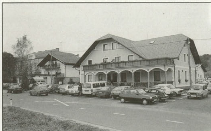
Poslovni objekt Leska