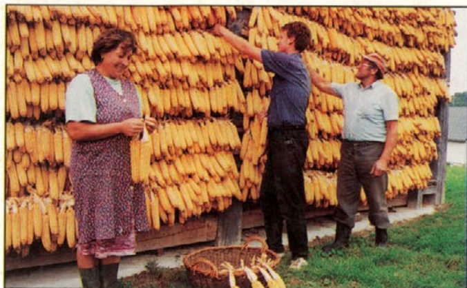
Pri Kokolovih v Zg. Leskovcu so bogat pridelek koruze pospravili kar ročno, koruzo pa zvezali in obesili na koruzjak.

Leto se počasi izteka in ljudje na deželi si bodo v zimskem času oddahnili od vsega že opravljenega dela. Letina je bila bogata, mnogim je povrnila ves trud in dala željen pridelek. V fotografski objektiv smo uveli nekaj zanimivih motivov letošnje jeseni..