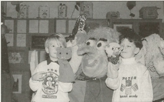
Mladi lutkarji na OŠ Podlehnik

Premalo odraslih se odloča, da bi si ogledalo lutkovno predstavo, zato ne vedo, kaj so zamudili. Tudi otroke velikokrat prikrajšamo ravno zaradi nas samih. Toda lutke so najbolj neposreden dedič obrednega gledališča, namenjenega odraslim. Otroku dajemo možnosti, da se izraža s svinčnikom, s čopičem, z besedo, z instrumentom, na gib pa skoraj pozabimo. Gibanje ni le sproščanje energije ali rekreacija, temveč tudi človekov izpovedno - umetniški izraz. Izrabimo priložnost na vsakem koraku in otroku ponudimo tudi lutko! Lutka naj bo prepričljiv in vpliven posrednik pisane besede, slike in glasbe, zato se z njo lahko uspešno borimo proti kiču, šundu in cenenosti. Svet lutk naj bi bil prvo srečanje otroka z umetnostjo. Lutka pa ni le pomanjšan človek, počenja pa vse tisto, kar bi radi počeli otroci.