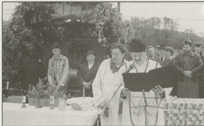
Ob krstu mošta