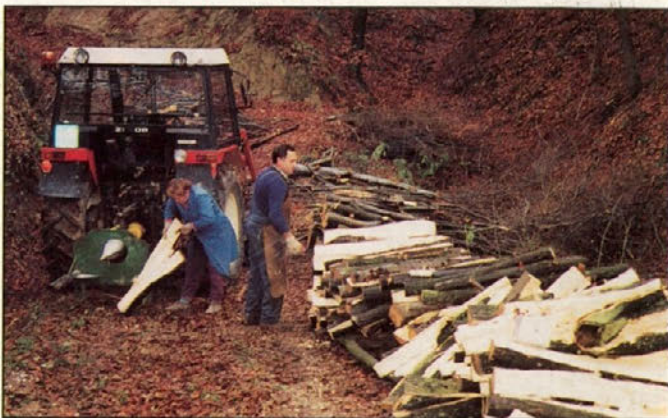
Drva so spravljena na varno, samo da nas pozimi ne bi zeblo.