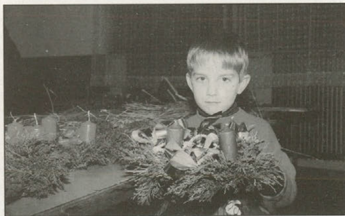
Tako se je s svojim adventnim venčkom pohvalil najmlajši udeleženec

peciva, potic, kvasenic, gibanic, krašenju tort, pripravljale bi lahko ribje in mesne jedi, obiskale seminarje za vzgojo rož in urejanje okolja, obravnavale bi zdravstvene teme, obnovile znanje pri ročnih spretnostih in še pri čem.