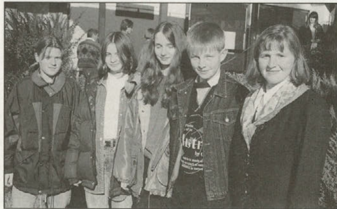
Uspešni planinci OŠ Podlehnik z mentorico