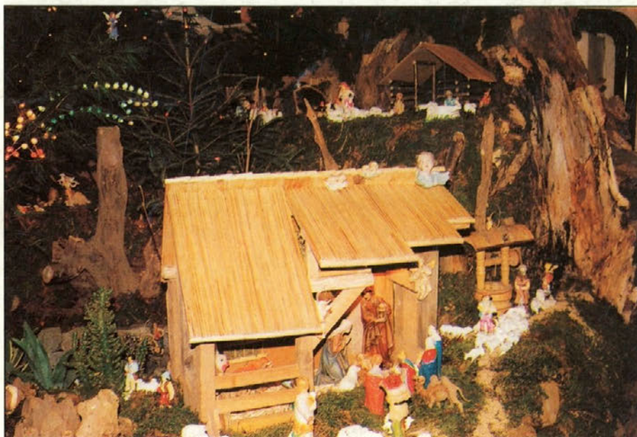
Božič - otroško veselje za vsakogar!