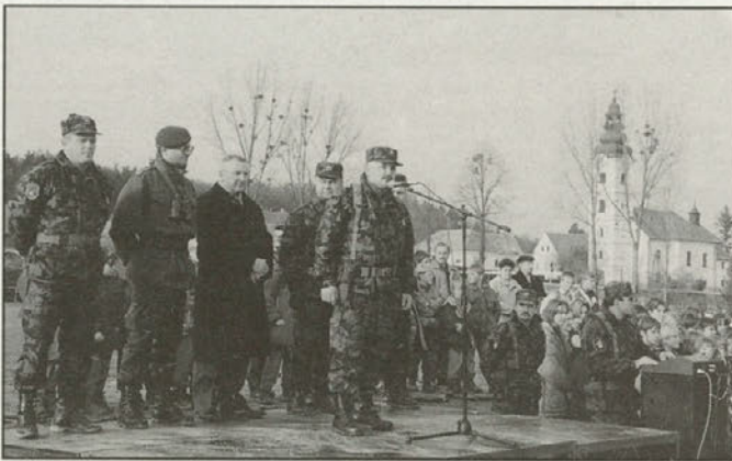
Na vojaški slovesnosti v Leskovcu

Ob zaključku služenja vojaškega roka pripadnikov 2. generacije enovitega usposabljanja drugega bataljona 72. brigade slovenske vojske, katere sedež je na Ptujju, je na območju KS Leskovec 5. decembra potekala obsežna taktična vojaška vaja. V vaji so sodelovali tudi pripadniki minometne čete 47. oklepne bataljona enote generala Maistra iz Maribora in vojašnice s Ptujja, 15. helikopterska brigada iz Brnika in vojaška policija 7. poveljstva.