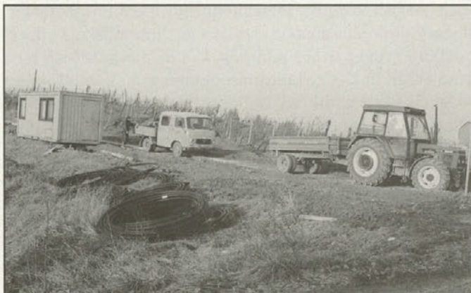
Vodovod Majski vrh - Podlehnik v izgradnji

V letošnjem letu se je zaključila izgradnja vodovoda v Trdobje in Šturmovcu, v novembru pa se je začela izgradnja vodovoda prve faze Majski Vrh - Podlehnik.