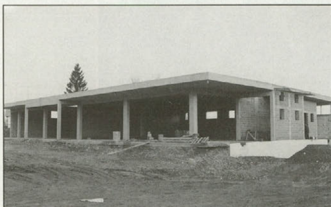
Gradnja novih prostorov je v polnem teku

Novi videmski poslovno - gostinski objekt je v neposredni bližini OŠ in kmetijske zadruge, kjer so ta trenutek še prostori občine. Zaranšek je še dejal, da bodo v novi zgradbi odprli veliko trgovino in gostinski lokal, tu bo tudi mesnica, cvetličarna, banka in še marsikaj, kar