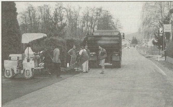
Novo asfaltno prevleko je dobila tudi regionalna v Trzcu

programe na tem področju, da si občani želijo urejenih cest, pa čeprav morajo pri investicijah še sami veliko prispevati. Tudi letos smo nekaj kilometrov cest uspeli asfaltirati, predvsem manjših odsekov, asfaltirani pa sta tudi že dve rokometni igrišči. Letos smo uspeli sanirati dva večja zemeljska plazova in še nekaj manjših.