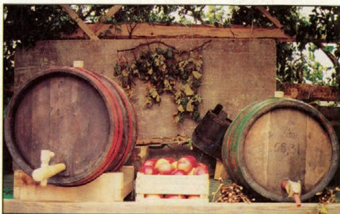
Vinca bo v sodih letos dovolj.