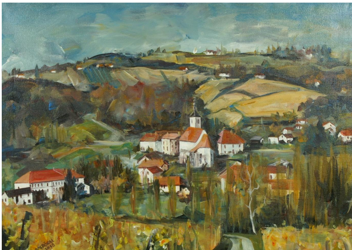
Slika je delo slikarja Bojana Oberčkala

TÜ PRI MIKLOŠI LÜŠNO JE, PA BO, KERI BUDE PRIŠO, NEDE JEMI ŽO.