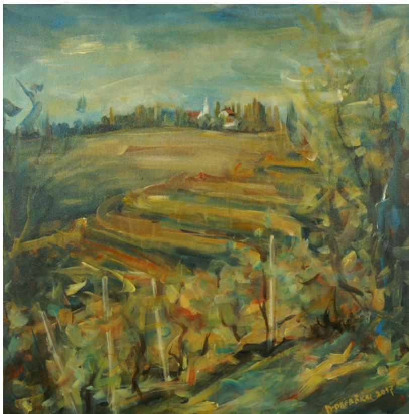
Slika je delo slikarja Bojana Oberčkala

Iz zbirke POCVÉTAJE avtorja Cirila Vnuka