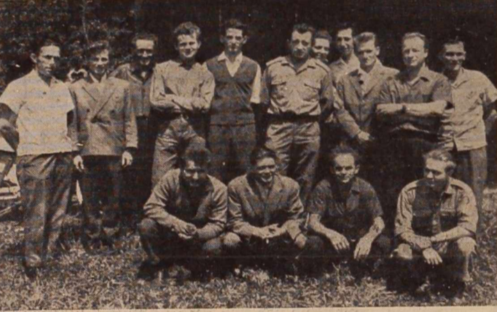
Strelci iz ljutomerske občine — udeleženci nedavno održanega strelskega tekmovanja v Presiki