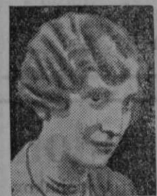
M. Podkrajšek frizer za dame in gospode, Ljubljana Sv. Petra cesta 12.

— Opozarjamo na inserat tvrdke ROŽMAN in prosimo, da se p. n. učiteljstvo pri nakupu sklicuje na n. j.