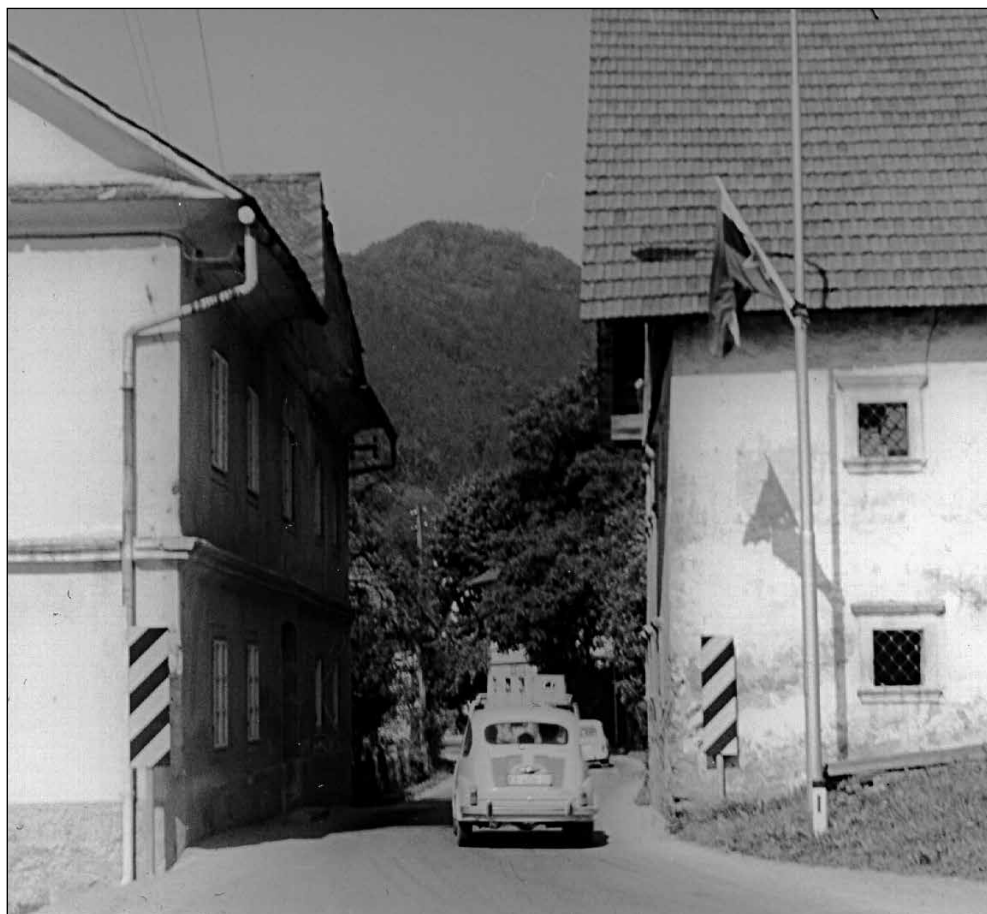
Češnjica, Lončarjeva in Čočeva hiša.