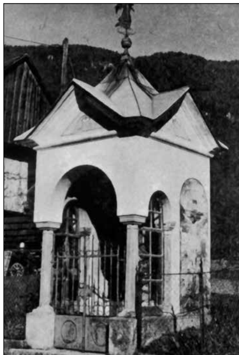
Znamenje iz knjižnice Vodnik po loškem ozemlju – Dražgoše iz leta 1982.