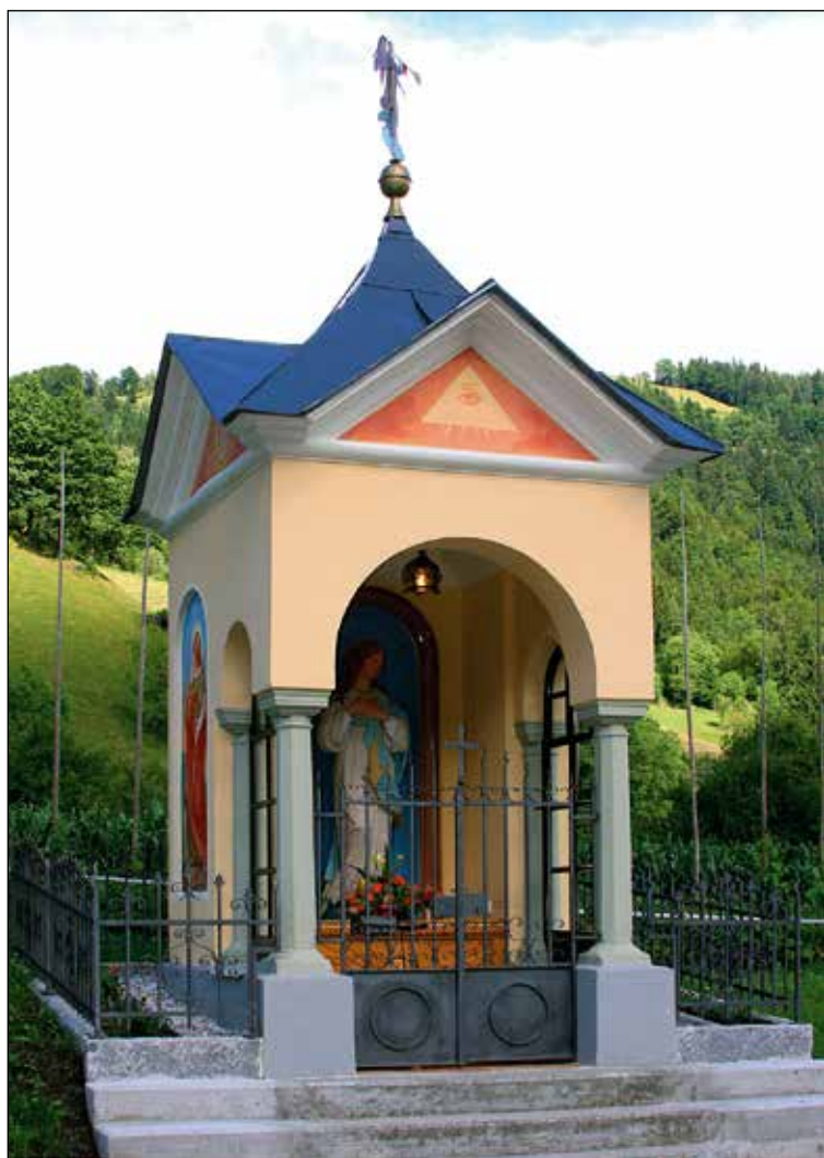
Vaško Marijino znamenje na Rudnu.