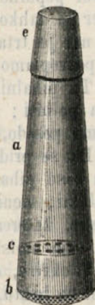
Pod. 1. Trosilka za žveplanje trt.

Kadar prvokrat žveplamo mlado popje, iz katerega so se razvili še le 3 ali 4 lističi, rabimo tako kositreno pripravo, kakoršno nam predstavlja podoba 1; imenovati jo hočemo tr o s i l k o . Spodnje, širše dno ( b ) je gosto prevrtano; nad njim je znotraj drugo dno ( c ) z večjimi luknjicami. Na ožjem koncu je pokrov ( e ). V odprto trosilko vsujemo toliko žveplene moka, da skoro napolnimo posodo ( a ). Potem jo zapremo in začnemo delo. Pri tem držimo trosilko vodoravno v roki in jo zmerno potresamo nad popjem, da se vsiplje na nje žveplena moka. Dvojno dno je napravljeno v namen, da pada v spodnji prostor samo toliko žvepla, kolikor ga more presevati gosto spodnje sito ( b ). Brez zgornjega dna bi zametali mnogo žvepla, ali pa bi se med delom luknjice v situ zatikale z žveplom in bi se z odpiranjem potratilo precej časa. Kjer rabijo trosilko brez dvojnega dna, natrošajo toliko žvepla, da je popje kar založeno ž njim, ko bi zadostovalo, da je le oprášeno, da se reši bolezn.