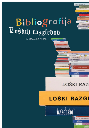
Naslovnica Bibliografije Loških razgledov

Z upravičenim ponosom lahko zremo na to svojevrstno loško enciklopedijo, ki že od leta 1954 prihaja v naše domove. S svojimi kakovostnimi in bogatimi poljudno-znanstvenimi in znanstvenimi vsebinami predstavljajo Loški razgledi domoznanski zbornik z najdaljšo neprekinjeno tradicijo izhajanja na Slovenskem.