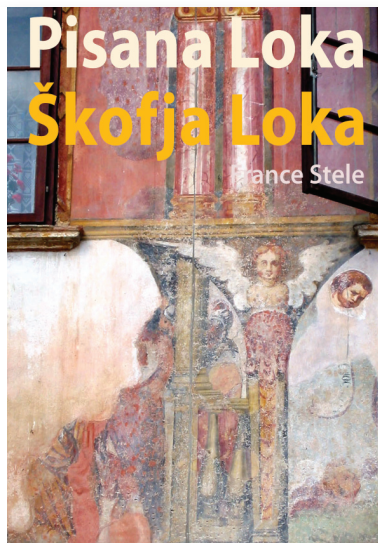
Naslovnica knjige Pisana Loka Škofja Loka