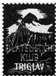
Poštni žig ob 60-letnici slovenskega planinstva — in znak Filatelističnega kluba, ki se imenuje po naši najvišji gori

podlagi tega zakona so 26. maja 1981 razglasili Triglavski narodni park in tako u zakonili varstvo 84 805 hektarov Zlatorogovega kraljestva s Triglavom v središču.