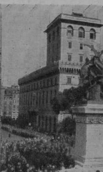
Benečanska palača v Rimu, s koje balkona je oznanil Mussolini vstop Italije v vojno ob strani Nemčije