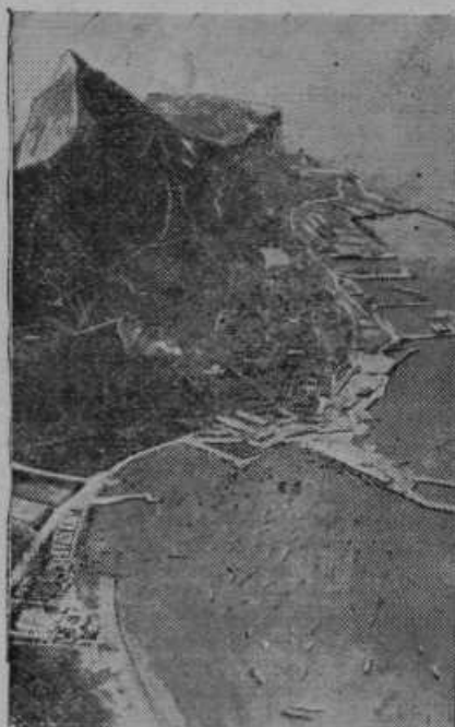
Angleška trdnjava Gibraltar, ki je ključ do Sredozemskega morja na zapadu