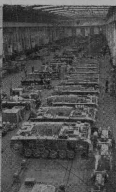
Vse države na vso moč hite z oroževanjem. Pogled v nemško tvornico za izdelovanje tankov