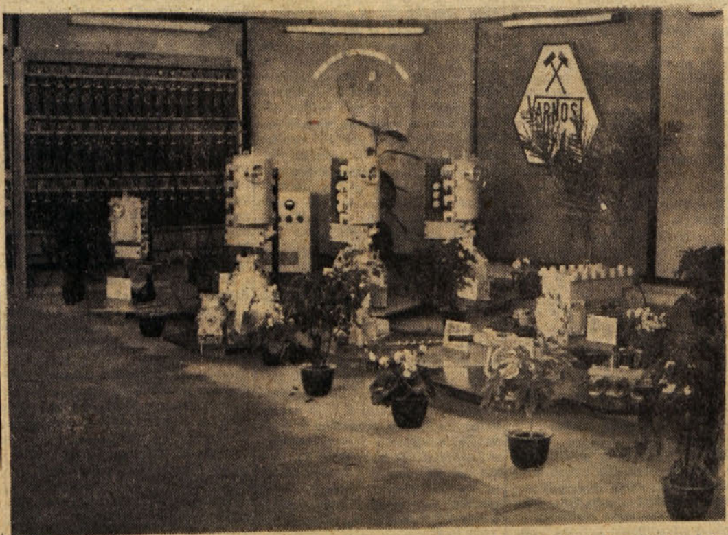
»Varnost« iz Zagorja proizvaja zdaj že vrsto izdelkov, ki jih razstavlja vsako leto tudi na mednarodnem zagrebških velesojnih

Dejstvo je, da ima zagorska »Varnost« perspektive za nadaljnjo razširitev in povečanje proizvodnje in da postane »milijarder« v ustvarjanju realizacije. Razumljivo pa je, da bo moral kolektiv pri teh prizadevanjih tudi sam priskočiti na pomoč in se bo zato dragoceno obrestoval vsak dinar, ki ga bodo danes, jutri ali pojutrišnjem namenili iz čistega dohodka podjetja za sklade podjetja, ker bodo za to laže in več jutri, pojutrišnjem, čez mesec ali leto dni proizvajali. Če bodo pa več proizvajali, bodo pa tudi laže reševali probleme, če pri tem omenjamo samo pomanjkanje kvalificirane delovne sile, ki je ni zaradi enostavnega razloga — ker ni stanovanj. Sicer v »Varnosti« tudi ta problem niso pustili v nemar, saj bodo del čistega dohodka, ki so ga ustvarili lani, le-