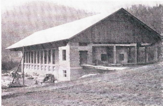
... in danes.