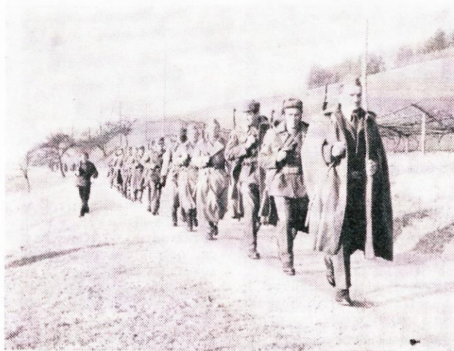
Pohod je bil dobro organiziran.

do cilja skozi dve kontrolni točki, najti pa jih je bilo potrebno s pomočjo kompasa in topografske karte. Na prvi kontrolni točki je moral vsak tekmovalc čim dlje skočiti v daljino, hoditi po brvi in vreči bombo v 30 m oddaljen