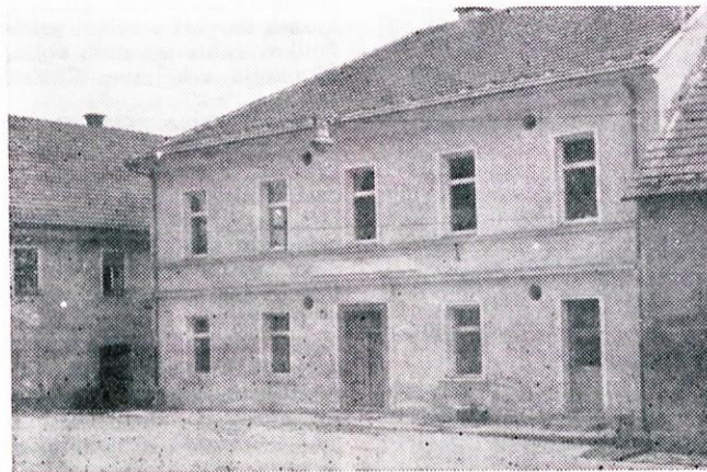
Iz stare šole bo kmalu nova moderna pekarna.

za razmeroma veliko investicijo, so se odločili, da se s 1.9.1970 priključijo Pekarni Center Ljubljana. To podjetje je ob zagotovitvi občine, da bo sodelovala pri gradnji nove pekarne tudi sprejelo priključitev in obvezo novogradnje pekarne. Občinska skupščina je nato pod-