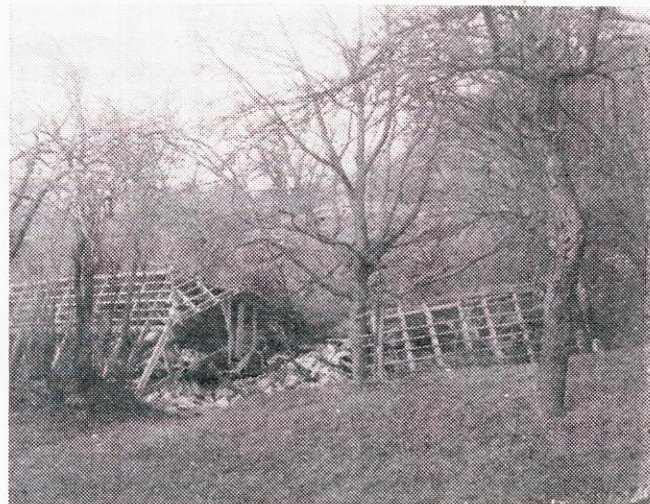
Plaz v Zapodju je naredil veliko škodo.

sproti ugotavljati vse spremembe prebivališč občanov. Zato pozivamo vse občane, ki časopisa ne prejema na dom, da to javijo uredniškemu odboru.