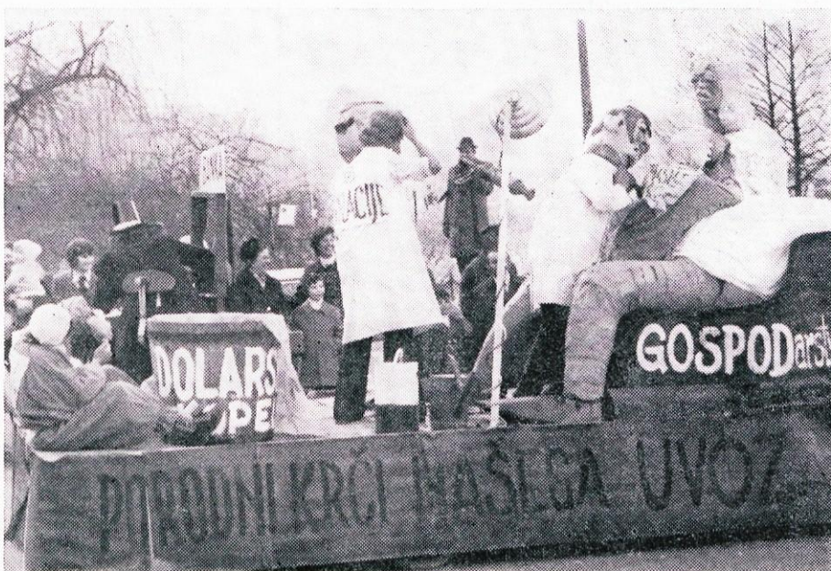
Tudi letošnji 18. pustni karneval v Litiji je bil zelo pester in je gledalcem nudil obilo zabave.