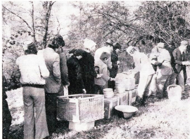
Tudi partizanska kuhinja je bila odlična.