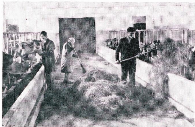
Tudi notranjost je lepo urejena.

Litija, izdelali pa smo jima tudi preusmeritvene programe gospodarjenja. Kmetiji se preusmerjata v pridelovanje krme za potrebe lastne živinoreje in v tržno proizvodnjo mleka in mesa. Kmetiji imata realne pogoje, da bosta letno proizvedli 90.000 l mleka in 14.000 kg prireje mesa. Preusmeritev pa ni poceni in kratkotrajen proces, saj sta morali kmetiji nabaviti potrebno mehanizacijo, zgraditi nova hleva in preiti iz dosedanje proizvodnje, ki je še bazirala na samopreskrbi na tržno proizvodnjo. V okviru občinskega praznika smo priredili otvoritev obeh hlevov. Namen otvoritve je bil pokazati nova hleva in se pogovoriti o realizaciji programa razvoja kmetijstva. K otvoritvi smo povabili večje število