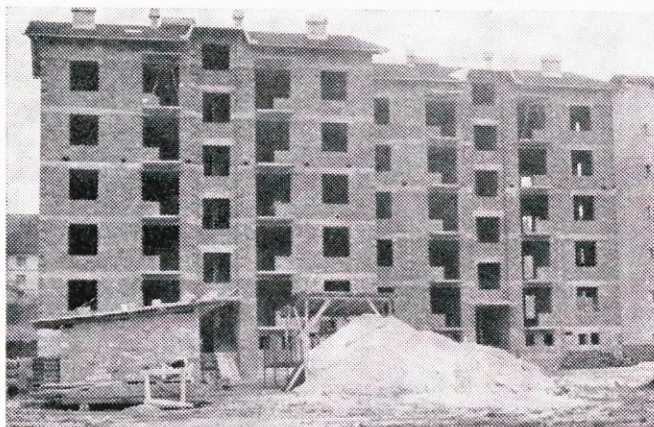
32 novih stanovanj na Rozmanovem trgu bo kmalu vseljivih.