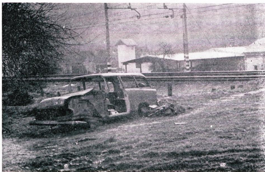
Kdo in kdaj bo odstranil te ostanke, ki »krasijo« Litijo?