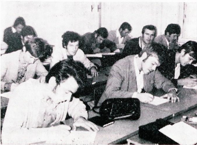
V okviru DU Litija se izobražuje mnogo občanov.

V kratkem bo Delavska univerza Litija slavila 15-letnico svojega obstoja. Ustanovljena je bila predvsem z namenom, da izobražuje odrasle občane na področju družbenega, strokovnega in splošnega izobraževanja. Do leta 1967 je Delavska univerza Litija opravljala samo izobraževalno dejavnost. V tem letu pa se je k Delavski univerzi priključila matična knjižnica, glasbeni center in kino. Pod upravljanjem in vodenjem Delavske univerze so vse navedene ustanove doživele velik napredek. Zlasti pa je bilo delo uspešno v knjižnici, ki je v letu 1967 imela 2.000 knjig, letos pa jih ima že preko 7.000. Na področju izobraževanja je Delavska univerza doslej izvedla in še vedno izvaja organizirano šolanje v mnogih dejavnostih. Preveč jih je, da bi jih naštevali. Najpomembnejše in najširše organizirane šole pa so: osnovna šola za odrasle, poklicne šole kovinske, elektro, kmetijske in krznarske smeri, ekonomska šola, tehniška šola kovinske in elektro smeri, delovodska šola, administrativna šola, šola za prometne tehnike, šola za voznike motornih vozil, za globinske vrtalce, višja šola za organizacijo dela, oddelek Pedagoške akademije in oddelek ekonomske fakultete.