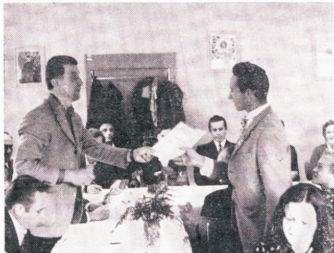
Iz ustanovne skupščine kluba zdravljenih alkoholikov.

Zato pomislimo na vse, predno dvignemo kozarec z