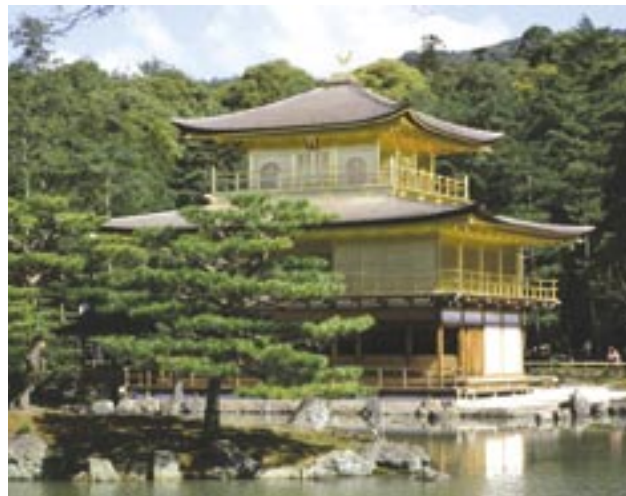
Slika 2: Podeželje krasijo številni templji in palače - Zlati paviljon v Kyotu.

Japonska politika za razvoj podeželja je precej podobna evropski, iz nje pravzaprav tudi izhaja, prilagojena pa je japonskim razmeram. Cilj obeh je ohranjanje poseljenosti ter kulturne pokrajine ter trajnostno usmerjen razvoj podeželskih območij in skupnosti prebivalcev, s tem pa izboljšanje kakovosti življenja in gospodarstva celotne države. Obe politiki si prizadevata za ustvarjanje uspešnega podeželskega gospodarstva kljub zmanjševanju cenovnih nadomestil - predvsem z oblikovanjem širšega spektra zaposlitev v kmetijstvu in novih nekmetijskih dejavnosti na podeželju (7). Japonska je tudi že v preteklosti namenjala veliko pozornosti in sredstev razvoju podeželja, prizadevanja pa so bila usmerjena predvsem v razvoj kmetijske infrastrukture (izboljšanje namakanja in izsuševanja zemljišč, urejanje kmetijskih zemljišč), v izboljšanje življenjskega okolja in infrastrukture na podeželju (posodabljanje podeželskih in kmetijskih cest, izboljševanje stanja okolja, kanalizacija in čistilne naprave) ter ohranjanju in varovanju podeželskih območij (ohranjanje obdelave kmetijskih zemljišč, zaščita pred naravnimi nesrečami ipd.). V vseh teh prizadevanjih je šlo predvsem za tehnične rešitve, ne pa za celostni razvoj podeželskih skupnosti, kar skušajo popraviti z novim zakonom.