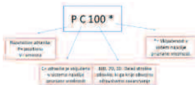
Slika 2: Sistem okrajšav za liste zdravil na recept. Figure 2: Prescription medicine list abbreviations system.

zavarovana oseba, če nima sklenjenega dopolnilnega zdravstvenega zavarovanja. Nekatera zdravila so lahko razvrščena na pozitivno listo, ki jih obvezno zdravstveno zavarovanje krije v celoti (pozitivna lista P100). V tem primeru gre za zdravila, ki se uporabljajo za zdravljenje oseb, bolezni in stanj, ki so podrobneje navedene v 23. členu Zakona o zdravstvenem varstvu in zdravstvenem zavarovanju (11). To so npr. zdravila za zdravljenje in rehabilitacijo malignih bolezni, mišičnih in živčno-mišičnih bolezni, paraplegije, tetraplegije, cerebralne paralize, epilepsije, hemofilije, duševnih bolezni, razvitih oblik sladkorne bolezni, multiple skleroze in psoriaze, infekcije HIV, kot tudi obvezna cepljenja, imunoprofilaksa in kemoprofilaksa skladno s programom. Posebno skrb se posveča tudi otrokom, učencem, dijakom, vajencem in študentom ter otrokom z motnjami v duševnem in telesnem razvoju, ki imajo krita zdravila na pozitivni ali vmesni listi v celoti.