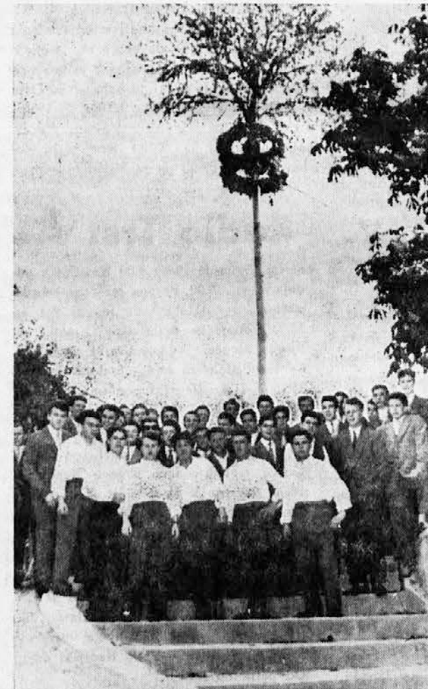
MLADINA V DOLINI OKROG MLAJA SREDI VASI

Odgovorni urednik: Stanko Stanič Tiska tiskarna Budin v Gorici