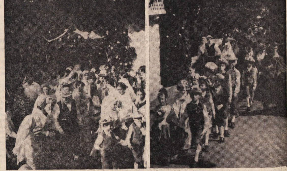
Seveda je moral ženin s svati še prej po nevesto: pred nevestino hišo na Colu. Ko sta si ženin in nevesta rekla eda, sta s spremstvom šla pod slavolokom na Colu