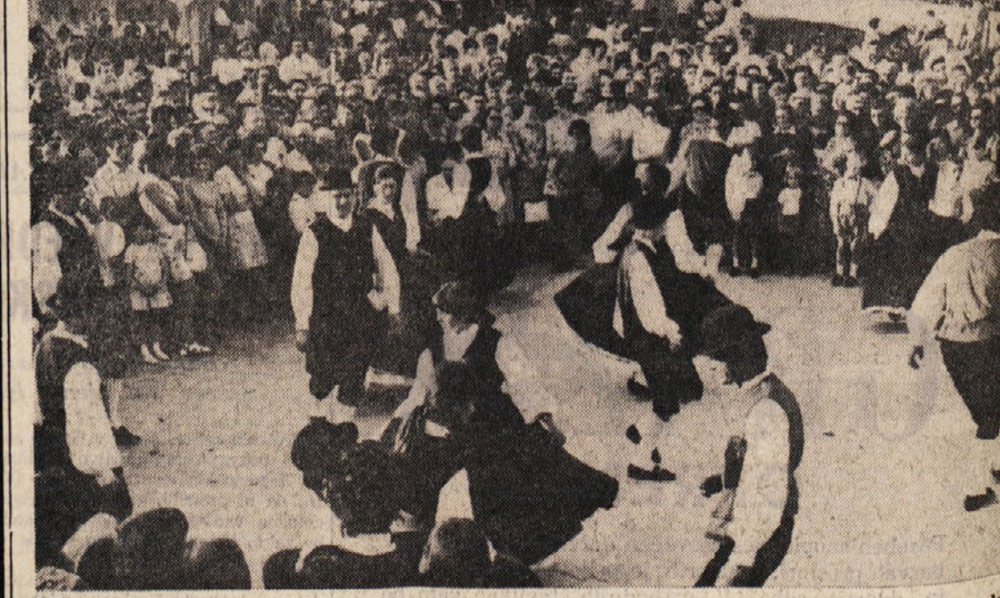
Sicer pa je tudi letošnja prireditelj privabila na Kras veliko ljudi. Na gornji sliki vidimo del množice, ki je prihitela k cerkveni svečanosti na «Tabora»

11. KANAL 21.00 Dnevnik; 21.15 Področja suše; 22.15 Neveux: «Vidocq», 2. nadalj. JUG. TELEVIZIJA 21.00, 23.50 Poročila; 10.35 TV v sli; 11.40 Ruščina; 12.00 Osnove splošne izobrazbe; 15.45 TV v sli ponovitev; 17.10 Angleščina; 18.40 Medvedov godnjavček; 19.00 Risanka; 19.15 Obzornik; 19.30 Torkov večer z J. Kampčičem; 20.05 O našem govorjenju; 20.30 Skrivnost rakave celice; 21.35 Tam, kjer se življenje konča — mafid. film; 22.55 F. Schubert: Simfonija št. 7.