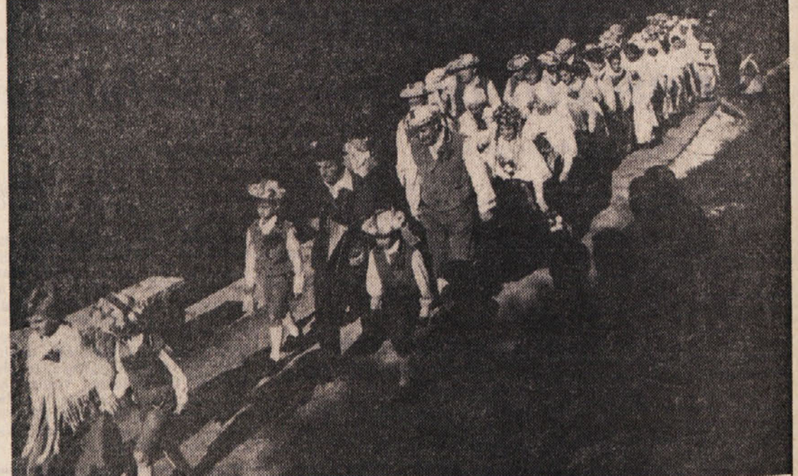
Ženin in nevesta gresta ob zvokih harmonike ter ob spremstvu svatov k poroki