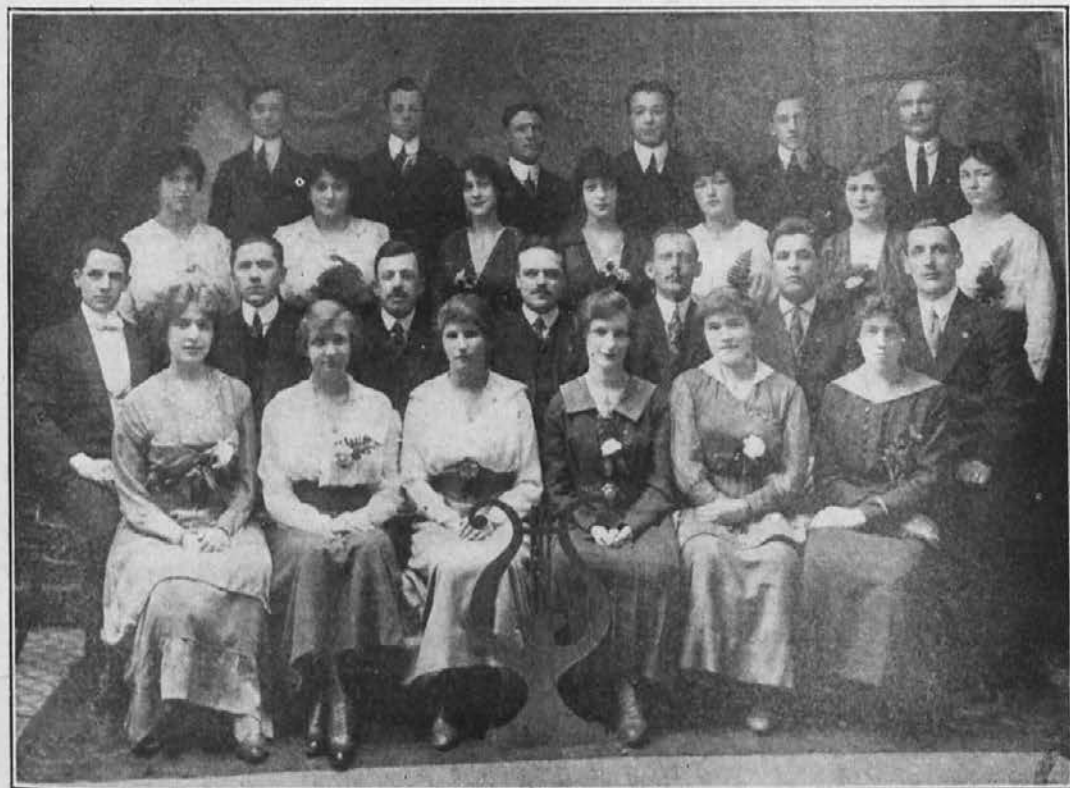
Slovensko pevsko in dramatično društvo "Danica" v Brooklynu, N. Y.

Zlasti pa zavisi post po naših družinah od gospodinj. Lena in nemarna gospodinja, ki se boji dela, skuha meso, samo da je hitreje in najlažje. Če jo pa vprašate, zakaj kuha meso, pa še naredi strašno pobožen obraz, češ,