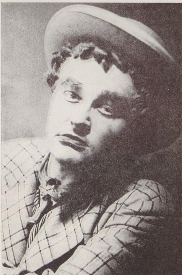
Stupica v »Beraški operi«