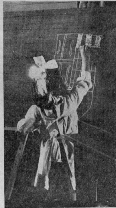
Učenka riše na šolsko desko jugoslovanski grb