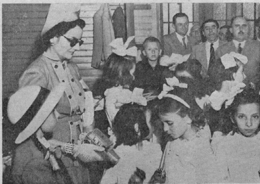
Gospa Niča Cankarjeva deli šolarjem igrače

Zato le bodite glasnik te velike ideje in slehernemu našemu človeku povejte, da domovina krvavo potrebuje njegove pomoči. Ko bo napočel tisti veliki dan, dan vstajenja in združenja vseh Slovencev v eni državi, tedaj bo domovina znala biti hvaležna za vse tudi bratom v tujini.