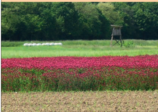
Danijela Berden: Preža