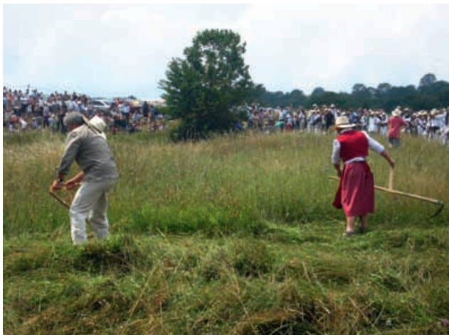
FOTOGRAFIJA MESECA – JUNIJ 2010