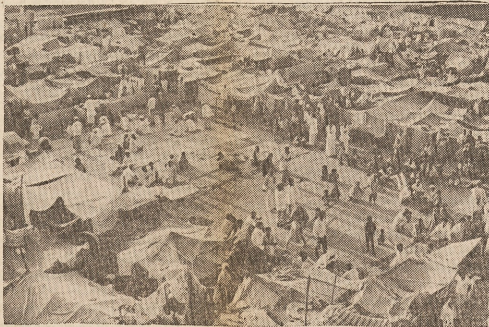
BEGUNCI V BENGALJI — Ko je bila Indija leta 1947 razdeljena v hindsko Indijo in islamski Pakistan, je prišlo do množičnih pobojev med hindu in muslimani. Tedaj so muslimanski Bihari bežali iz Indije iskat zavetje v Vzhodni Pakistan, kjer je bilo prebivalstvo muslimansko. Bihari so po jeziku, kulturi in rasi različni od Bengalcev, prebivalcev nekdanjega Vzhodnega Pakistana. Ko je prišlo lani do upora v Bengaliji, so Bihari potožili s pakistansko vlado in se s tem zamerili Bengalcem. Sodijo, da za nje v Bengaliji ni bodočnosti in bi se radi preselili v (Zahodni) Pakistan, od koder se bo okoli 400,000 Bengalcev vrnilo v Bengalijo. Za enkrat je dober del Biharov v zasilnih taboriščih, kot je tole na sliki v glavnem mestu Bengalije Daki. V njem živi okoli 10,000 Biharov, pretežno žena in otrok, za katerih prehrano skrbi Mednarodni Rdeči križ.

še sama revna in nadložna? Ne! Zanj je čutila le usmiljenje in pritajeno krivdo... Odnagnala je misli... V sosednji senožeti so pele orglice. Zatopljena v misli ni opazila, kdaj je prišel Tine, se vrnil v vrsto pred njo. Začudila se je.