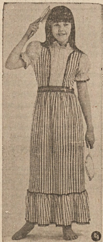
MODERN VICTORIAN — All the charm of yesterday is combined with the soft comfort of today's knit cotton in this full-length night-gown. Stripes and dots team up for pleasing contrast in Carter's lace and ribbon-trimmed style.

Kdaj pa kdaj se je bežno ozrla po nebu, kakor da se ogleduje v zrcalu. Saj v nekaterih trenutkih samo sebe ni poznala in se ni razumela. Tudi se je redko