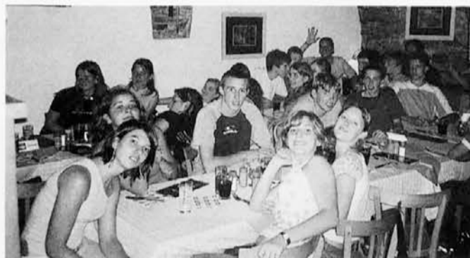
Kosilo v Ljubljani