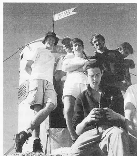
Pri Aljaževem stolpu

Po tem sprehodu smo se odpravili na Koroško. Tam smo bili kar tri dni, to se pravi do srede. Stanovali smo na Rebrci. Ogledali smo si Mohorjevo družbo v Ce-