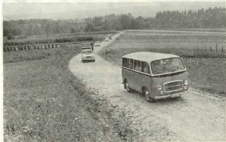
Po novi cesti so na Brde pripeljali prvi avtomobili