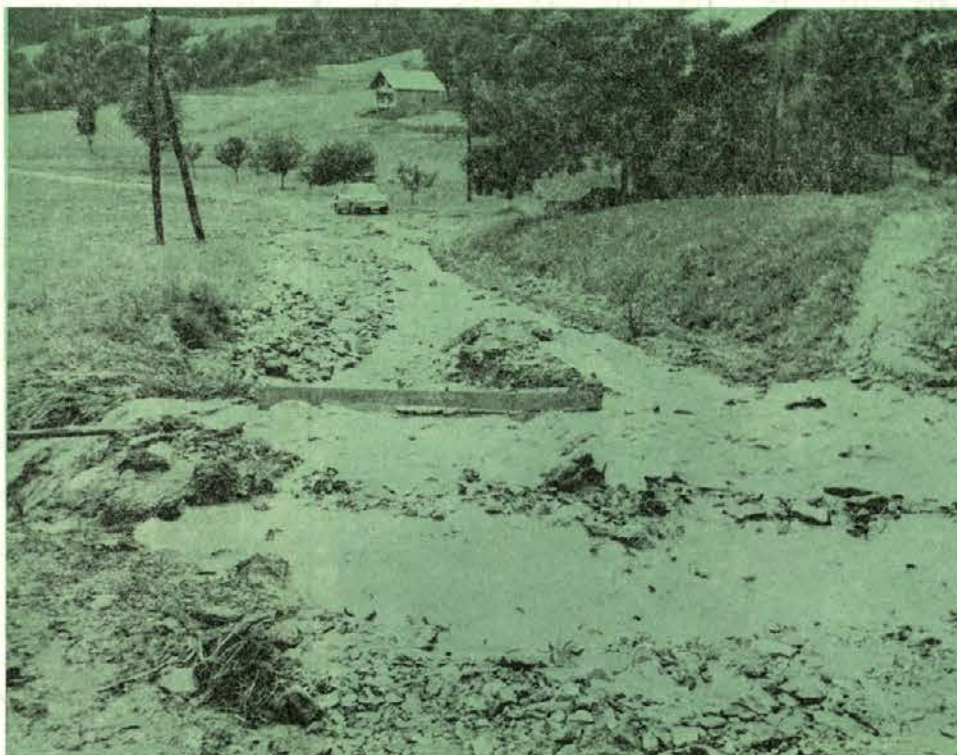
Tudi 15. julija je neurje zajelo območje naših gozdarskih obratov. Naš posnetek je s ceste na Selah pri Slovenj Gradcu, kjer se je po močnem nalivu cesta spremenila v strugo.

Razpisne pogoje si preberite v Obvestilih št. 3 — junij 1970.