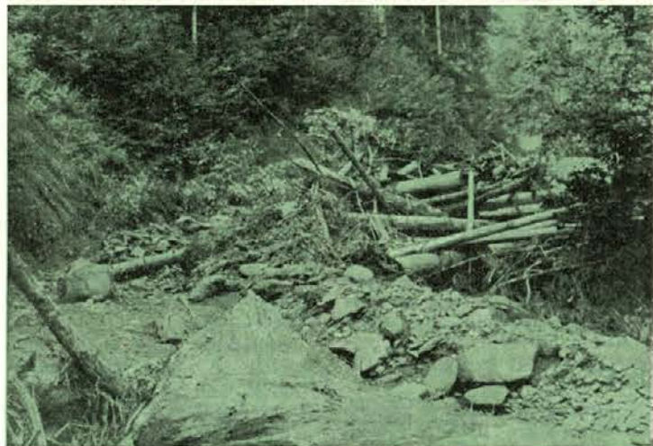
Bundrov jarek. Voda si je napravila pregrado iz odnesenega lesa.

čil: »Ponoči in jutri so možne krajevne nevihte.«