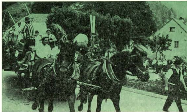
Skozi Črno so odmevali cepci mlatičev in za hip pričarali idilično melodijo kmečkega poletja, pa čeprav so tokrat mlatili prazno slamo