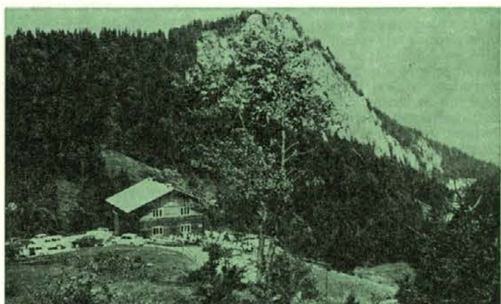
Lovski dom na Ježevem v Bistri