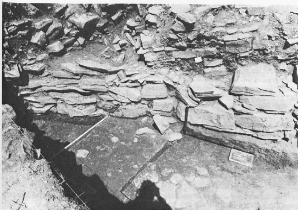
Fig. 2: Elleri, particolare della struttura più antica.

Sl. 2: Kaštelir pri Jelarjih. Pogled na najstarejše obzidje.