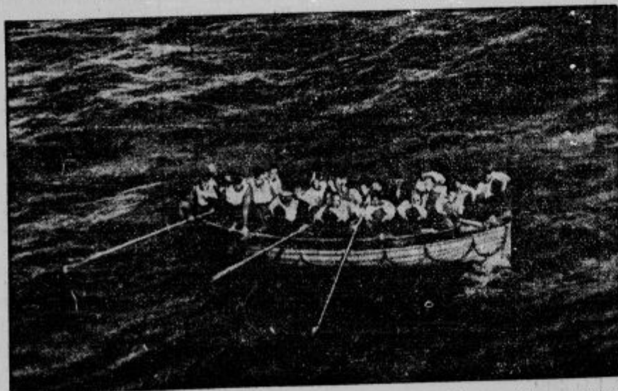
stešilni čoln angleškega tovornega parnika »Regent Tiger«. Posadko 44 mož s potopljenega parnika je vzel parnik »Jean Jabot« na svoj krov.