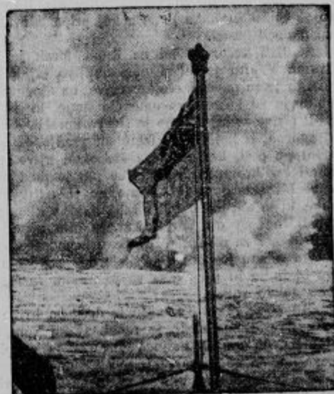
Angleška zastava vibra nad Oceanom. Ali bo še dolgo? — pišejo nemški listi.