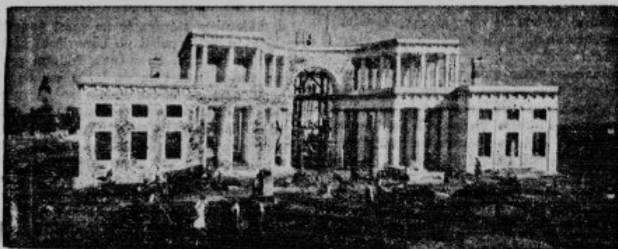
Vrt mrtvih na Žalah pri Sv. Križu v Ljubljani. Pogled na glavno poslopje Žal, okrog katerega je postavljenih 10 kapelic za mrliške odre.