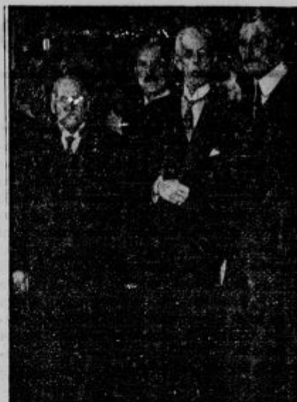
Poglavarji štirih severnoevropskih držav so se prejšnji teden zbrali na skupen posvet ter izjavili, da hočejo ostati za vsako ceno nevtralni. - Od leve proti desni: predsednik finske republike Kallio, norveški kralj Haakon, kralj Gustav švedski in Kristijan danski.