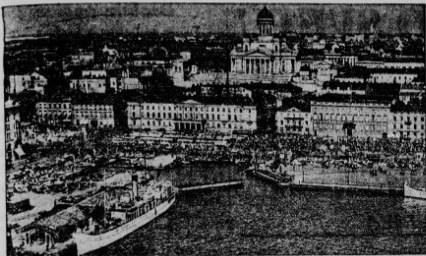
Olimpijsko mesto Helsinki. Pogled na južno pristanišče s cerkvijo sv. Nikolaja. Sovjetska Rusija bi tudi Finsko rada dobila pod svoje varušvo.