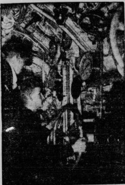
V podmornici, kjer je vse en sam stroj.