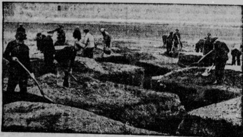
Poljske strelske jarke zasipavajo.