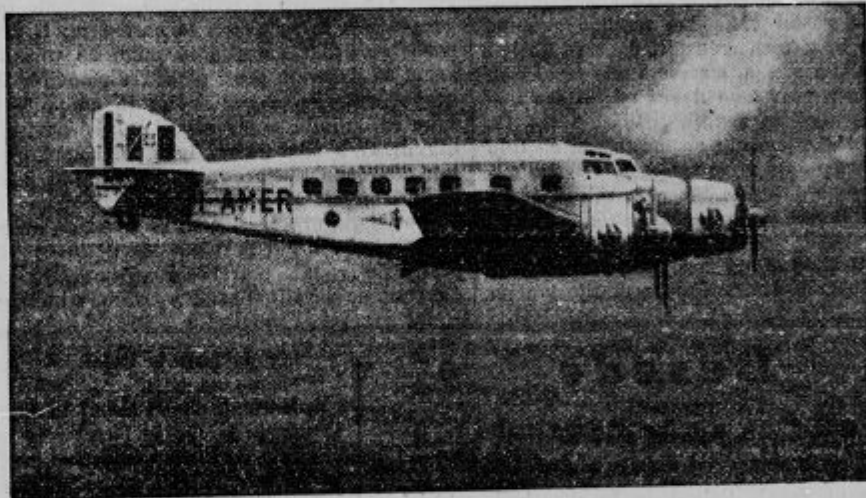
Novo italijansko letalo za potovanje v Ameriko