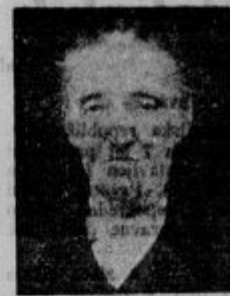
številu. - Pokoj njeni blagi duši, žalujočim sorodnikom pa naše sozajlec!

Št. Jurij pod Kumom. Prav lepo smo letos praznovali praznik Kristusa Kralja. Mladina je skoro vsa v velikem številu pristopila k sv. obhajilu. Člani fantovskega odseka in dekliškega krožka pa so ta dan pristopili k sv. obhajilu v krogih, prvič odkar obstajajo, kar je na vse navzoče na-