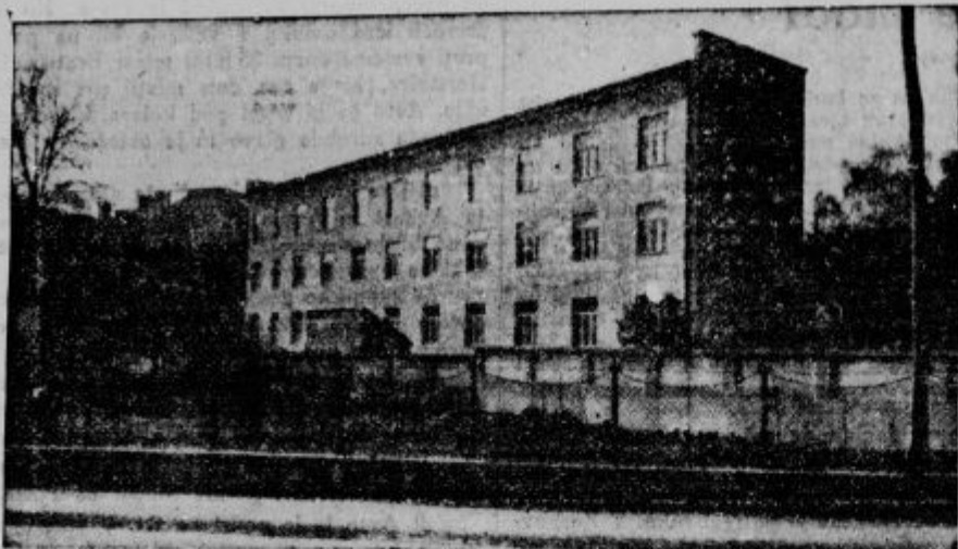
Novi veliki prizidek Šlajmerjevega doma v Ljubljani bo sprejel prve bolnike še pred božičem.

Grozote vojske na Poljskem: Hišo je porušila letalska bomba, ubila hčer, očetu se je pa ob pogledu na vse to zmečalo.