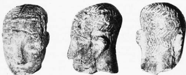
Sl. 2. Primer plastike iz Butmira

Vsebinsko je zadostoval že navaden valj z ali pa tudi brez nosa oziroma ptičjega lica, da je vzbudil v lastniku ali v gledalcu vtis, kaj takšna figura predstavlja. Da v takšnih primerih ne gre gledati niti najmanjše umetniške pobude, je jasno. Nesporno je pa tudi, da bi tudi pri predstavah, kjer ni glavna oblika, temveč vsebina, mogli pričakovati nekoliko več umetniškega izražanja, kakor ga imamo pri velikem delu naših statuet. Težko se je v tem primeru odreči domnevi, da na izdelavo ni vplivalo neko splošno pravilo, recimo nekakšna moda, kakor jo opažamo pri drugih keramičnih izdelkih v obliki raznih tipov, ki prav tako zajemajo neko geografsko in časovno območje. Seveda se pa to pravilo ni toliko nanašalo na oblikovno predstavo, kolikor na vsebinsko, zaradi česar je bila oblika pač podrejena. Nekateri bolj naturalistični primeri,