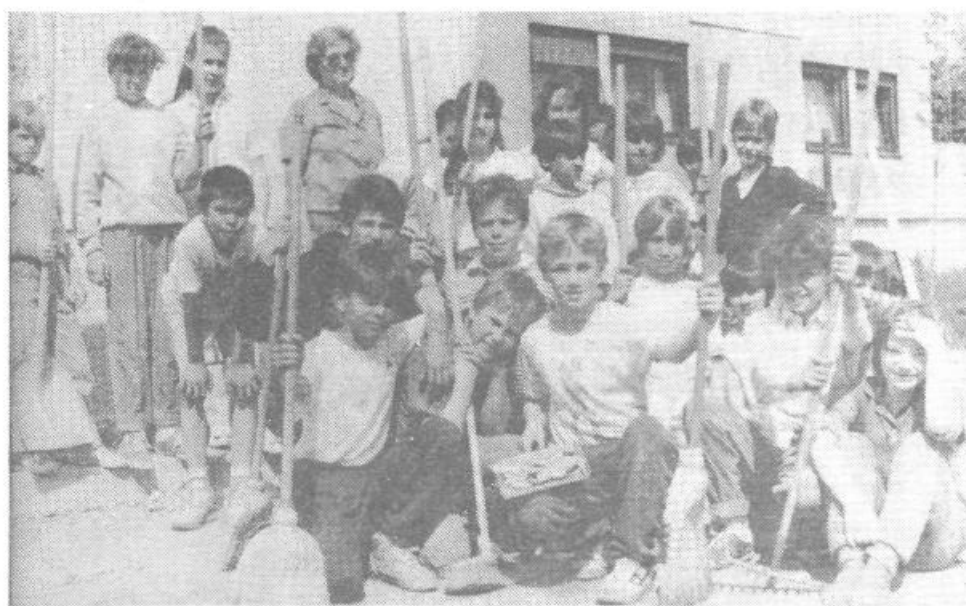
»Udarna« ekipa Jamove 50