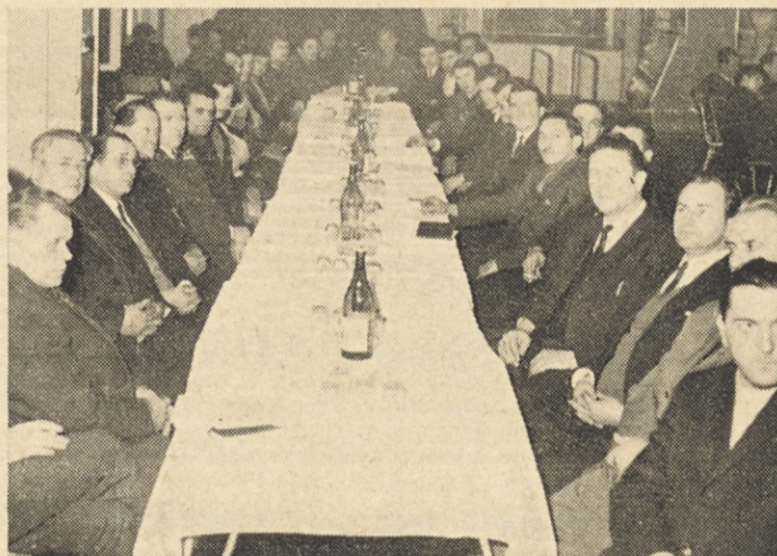
Nepričakovano je bila udeležba na občnem zboru gasilcev odlična