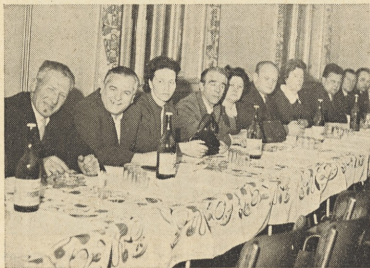
Družabni večer je potekal v tovariškem razpoloženju.

Vsem članicam kolektiva ob 8. marcu naše iskrene čestitke!