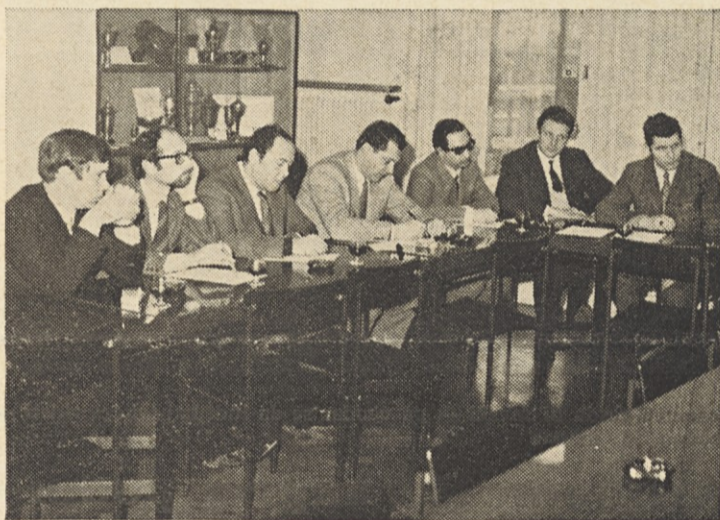
Gostje iz Italije v naši sejni sobi