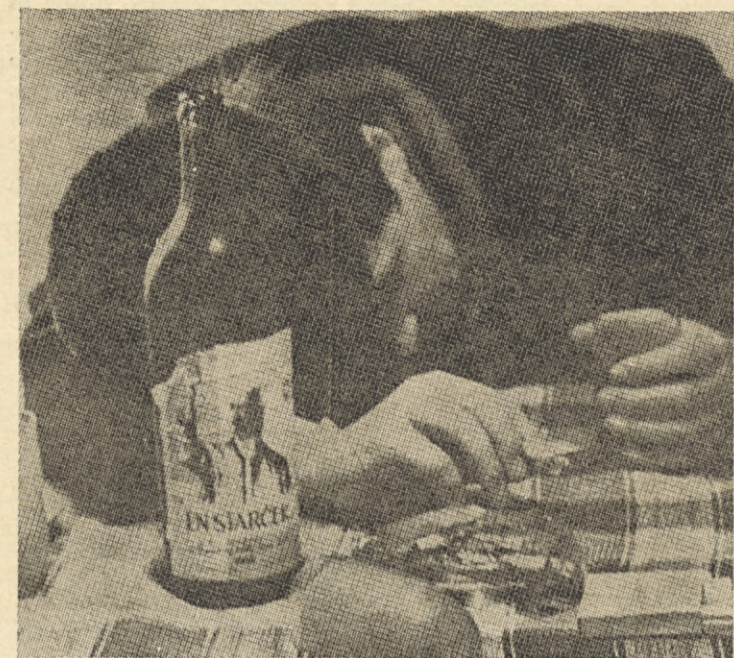
Posnetek resda ni savski — pa vendar se da tudi kaj takega videti — recimo 15. v mesecu