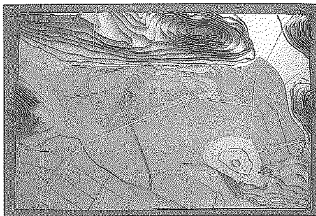
Prikaz ureditve ornitološkega rezervata. Scheme of the ornithological reserve's arrangement.

Ureditev ornitološkega rezervata v Škocjanskem zatoku, ki ga predlaga projekt, bi primerno razrešila večino danes obstoječih težav v prostoru. Škocjanski zatok kot naravni park vključuje v zeleno vodni pas, ki obdaja staro mestno jedro Kopra. Naravni park bi postal področje za sprostitve napetosti, ki nastajajo ob neskladnih dejavnostih v okolici zatoka. Park bi nudil lep pogled z okoliških gričev ter s ceste in železnice, ki pripeljeta v Koper. Vtis o mestu bi bil tako mnogo bolj prijeten in zanimiv, saj bi bil Koper s te strani videti kot