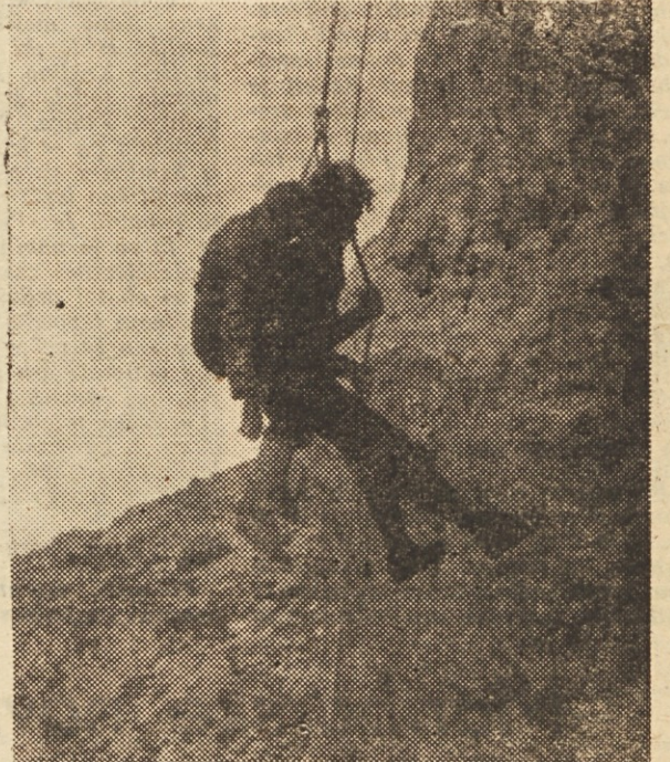
Reševanje ponesrečenca z Grammingerjevim sedezem v zahodni steni Planjave

voril eden iz gruče: »Fantje, tole bi moral gledati vsakdo, ki začena plezati v gorah — potem mislim, da bi si dvakrat premislil... Premalo se ljudje zavedajo, da se pri plezanju lahko tudi kdo ubije. Skoda je teh mladih ljudi — starši jih spravijo v življenje do univerze, potem pa v mladostni zagnanosti zagrešijo usodno napako in končajo na komaj začeti življenjski poti. Zal bo v življenju gornikov zmeraj tako. Le tisti,