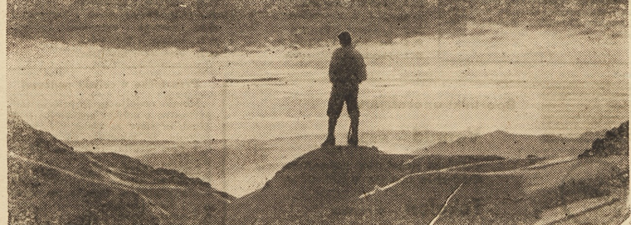
Preveč je sonca tam gori in praveč tišine v skritih zakotjih nad stenami, da bi me mogle neštete smrti v gorah odvrniti od gora, da se jim ne bi zapisal do konca življenja

»Vidiš, kljub vsem žalostim in tegobam, kljub žuljem, ki nam jih razrežejo namarnice nahrbtnikov v rama, ne bomo nikoli nehali ljubiti tistih molčečih skal. Preveč je sonca tam gori na vrhovih in preveč tišine v skritih zakotjih nad stenami, da bi me mogle vse te neštete smrti odvrniti od tega, da se goram ne bi zapisal do smrti. Človek pa mora uravnati svoja tveganja v mejah razsodnosti in subjektivne moralne in fizične moči. Svojo glavo pa nesem na prodaj samo takrat, kadar gre za rešitev ali pomoč človeku.»