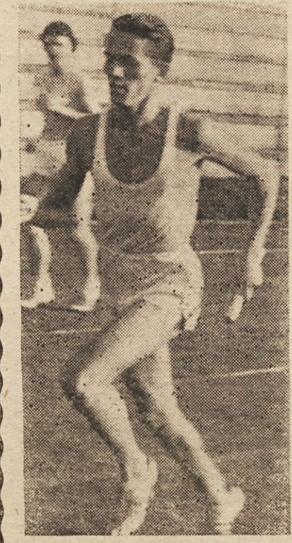
Naraks je »vlekel« svojo štafeto

Sledile so težke borbe v času protiljudskih režimov, minila je druga svetovna vojna, kjer si je jugoslovanska mladina pod vodstvom SKOJ priborila neminljivo slavo in ugled v svetlu, po osloboditvi pa so se začele številne delovne akcije — mladina je bila pod vodstvom KPJ in SKOJ spet v prvih borbenih vrstah. Mladina si je torej gradila svojo bodočnost in lepše življenje jugoslovanskih narodov, gradila si je tovarne, šole, razen tega pa tudi številne objekte za kulturno in telesnovzgojno dejavnost. Vse to je pomenilo revolucionarni boj jugoslovanske mladine in zato je 40-letnica ustanovitve SKOJ pomemben mejnik v borbi jugoslovanskih narodov za lastno svobodo in slaven spomin na vse, ki so žrtvovali tudi svoja življenja za svetle ideale. Slava paullim herojem, sekretarjem, mladincem in borbem SKOJ! Naj živi ZKJ in njevi generalni sekretar tov. Tito, pod vodstvom katerega smo prišli do lepše bodočnosti jugoslovanskih narodov!