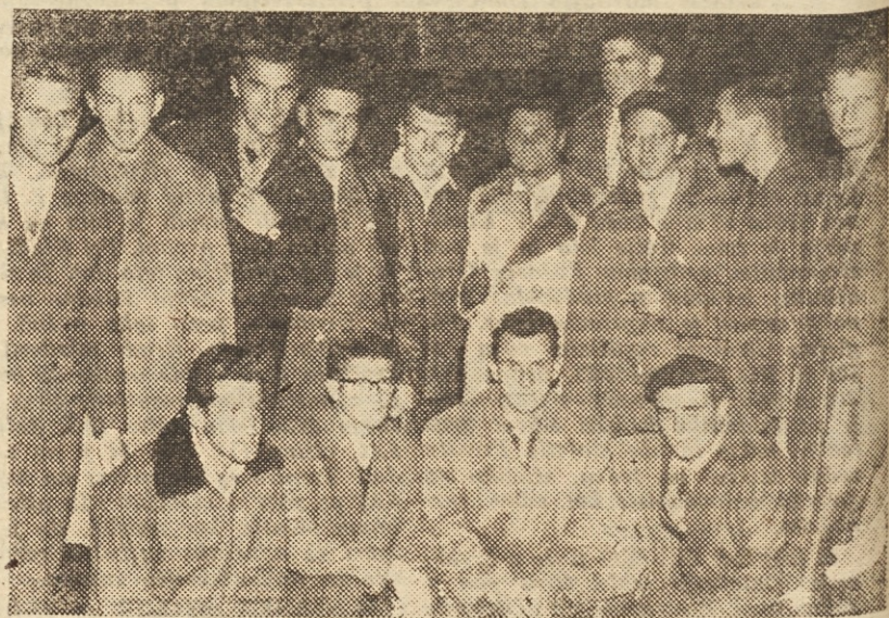
Košarkarji Odreda so v sredo zvečer odpotovali v Tuzlo na kvalifikacijsko tekmo vstop v zvezno košarkarsko ligo. Zazeheli smo jim srečno pot in popoln uspeh na tem tekmovalju

Do konca je res še daleč, daleč... in vendar se morda že danes kažejo obrisi, ki spominjajo na končni vrstni red.