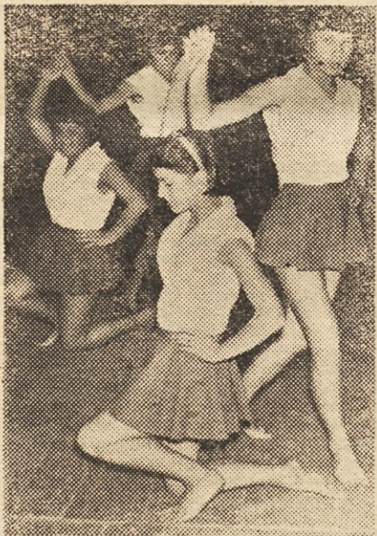
Na akademiji v Štorah so mladinke požele mnogo priznanja