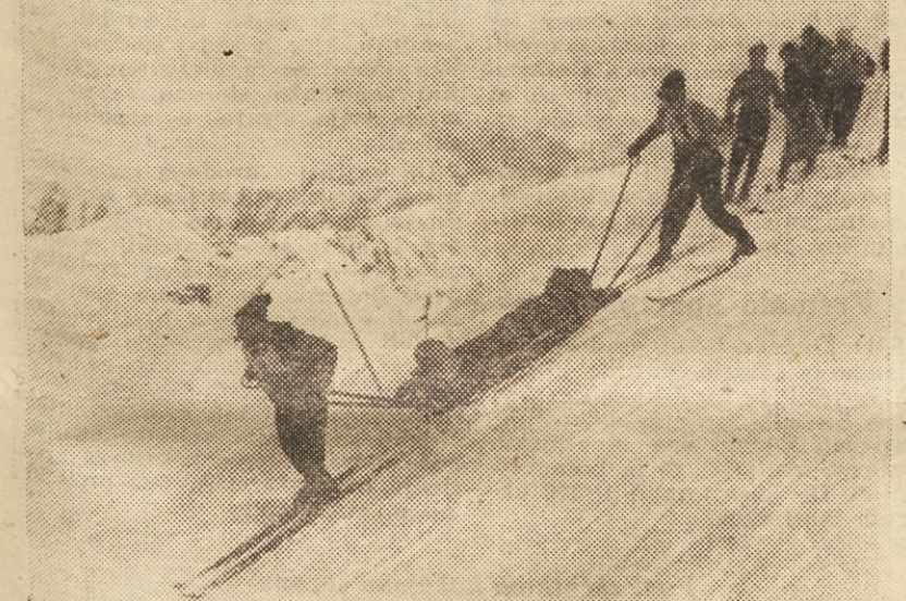
Ob smučarskih nesrečah v gorah prepeljejo ponesrečenca v dolino z Akia čolnom