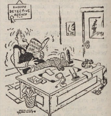
Ce detektiv bere detektivske romane.

g— Naš klirinški promet in dolg v Češkoslovaški. Naš uvoz iz Češkoslovaške se je to leto podvojil. Lansko leto smo v istem času uvozili iz Češkoslovaške raznega blaga za 86.8 86.8 milijonov, letos pa že za 192.9 milijonov. Ta povečani izvoz je posledica sankcij proti Italiji. Tekstilnih proizvodov smo prej uvozili precej iz Italije, po uvedbi sankcij smo pa krili vso potrebo iz Češkoslovaške. Naš klirinški dolg je narastel do konca preteklega meseca na 128.7 kč. to je po našem oficijelnem kurzu okroglo 233 milijonov dinarjev.