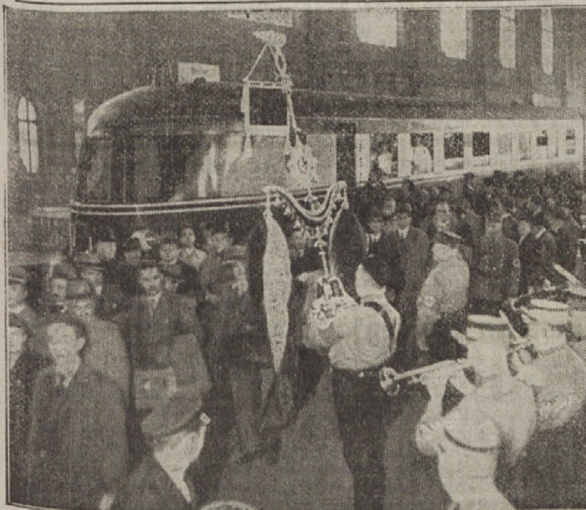
S 15. majem začne na progi Berlin — Monakovo voziti tale brzec, ki ga ženo električni Dieslovi motorji. Pot iz Berlina v Monakovo »rebrzi« take voz v 6 urah 40 min. Nemet mu pravijo »Leteci Monakovčan«

Tudj tebe naj »matra« dragi čitatelj, kdo je bil fant! Jaz že vem! Če si tako radoveden pa se informiraj v Monte Carlu! Zapik! Mikl.