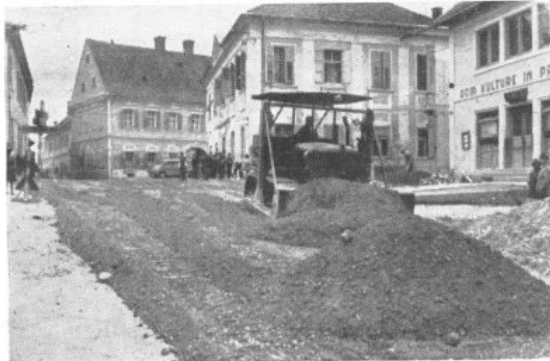
Tak je bil pogled na središče Lenarta, ki pa se tudi te dni ni kdo ve kaj spremenil

mnenju nekaterih strokovnjakov stala 40 milijonov dinarjev.