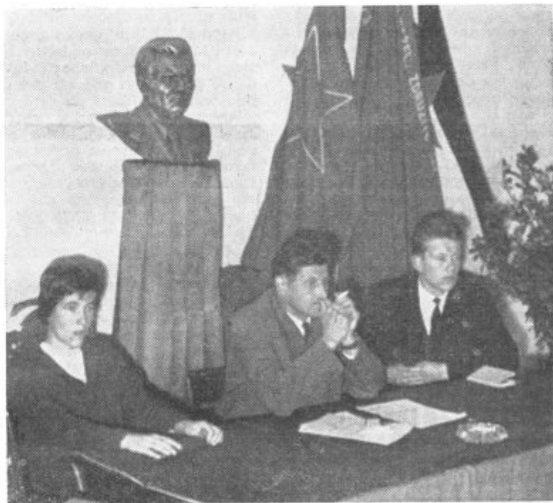
Delovno predsedstvo občinske konference ZKS Lenart

Poseben problem so tudi strokovni kadri. V podjetjih manjka predvsem takega strokovnega kadra, ki bi sproti analiziral vzroke in pomanjkljivosti, ki bi jih pravočasno posredoval organu samoupravljanja, da bi le-ti lahko elastično in pravočasno ukrepali. V podjetjih ni konkretnih analiz o tem, kaj bi se dalo ukreniti za izboljšanje poslovanja, za boljše izpolnjevanje planskih nalog. Nobeno podjetje ne štipendira kadra na srednjih ali višjih šolah. Glede izvajanja družbenega plana nekatera podjetja menijo, da ga ni potrebno upoštevati in izvajati. Ponekod so šli na zniževanje planov od tistega, ki ga je predvidel občinski plan. Nekaj je tudi takih, ki so lasten plan celo dvignili nad občinski plan. V kolektivih, kjer so interni plan postavili nižje kakor to za njih predvideva družbeni plan občine, gotovo niso bili do podrobnosti seznanjeni z določili družbenega plana, ker se sicer plan podjetja ne bi mogel tako razlikovati od družbe-