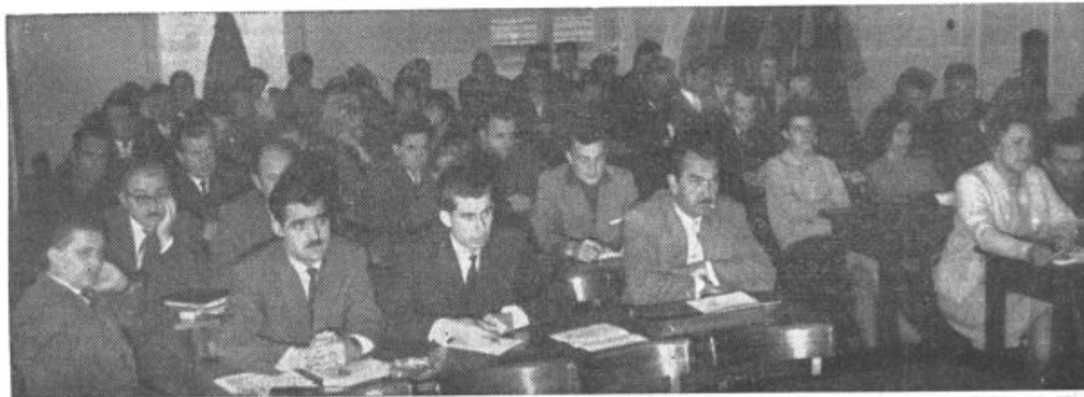
Delegati na občinski konferenci ZKS Lenart med poslušanjem referata o bodočih nalogah ZK v občini Lenart